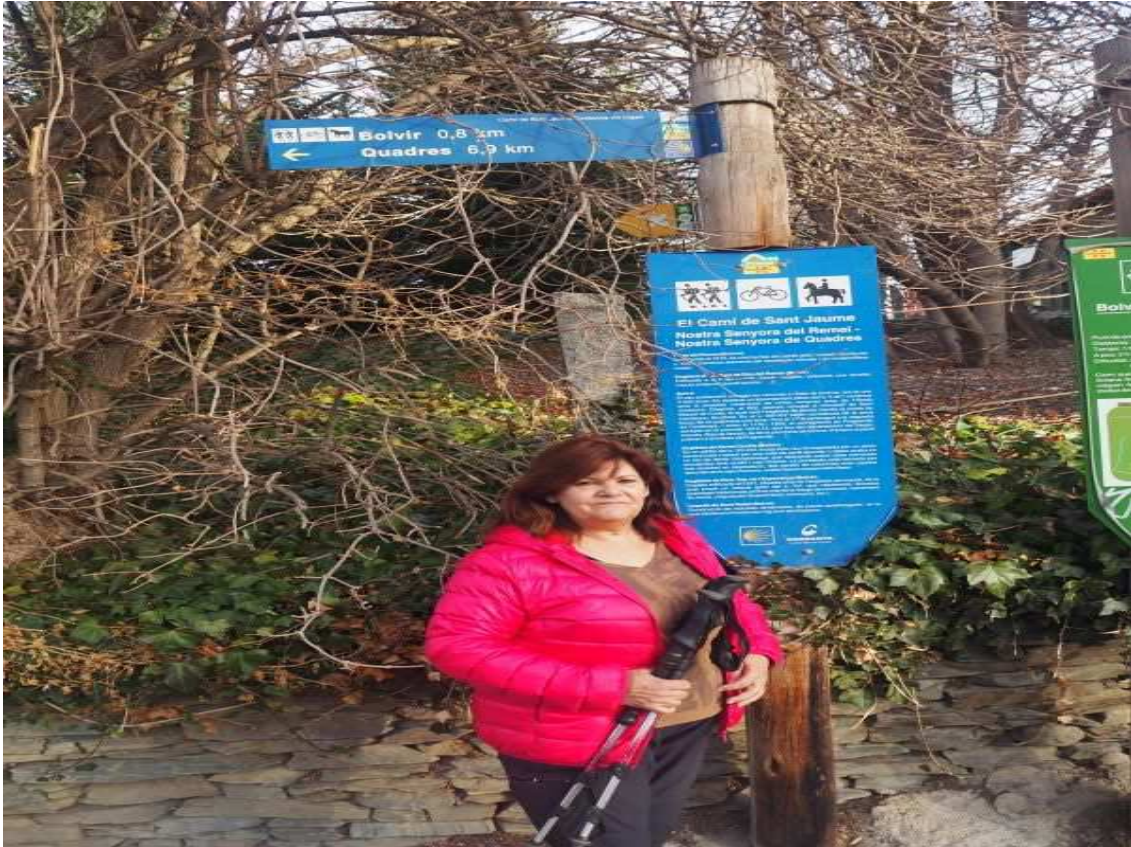
Un tram del camí a la zona de la Cerdanya.