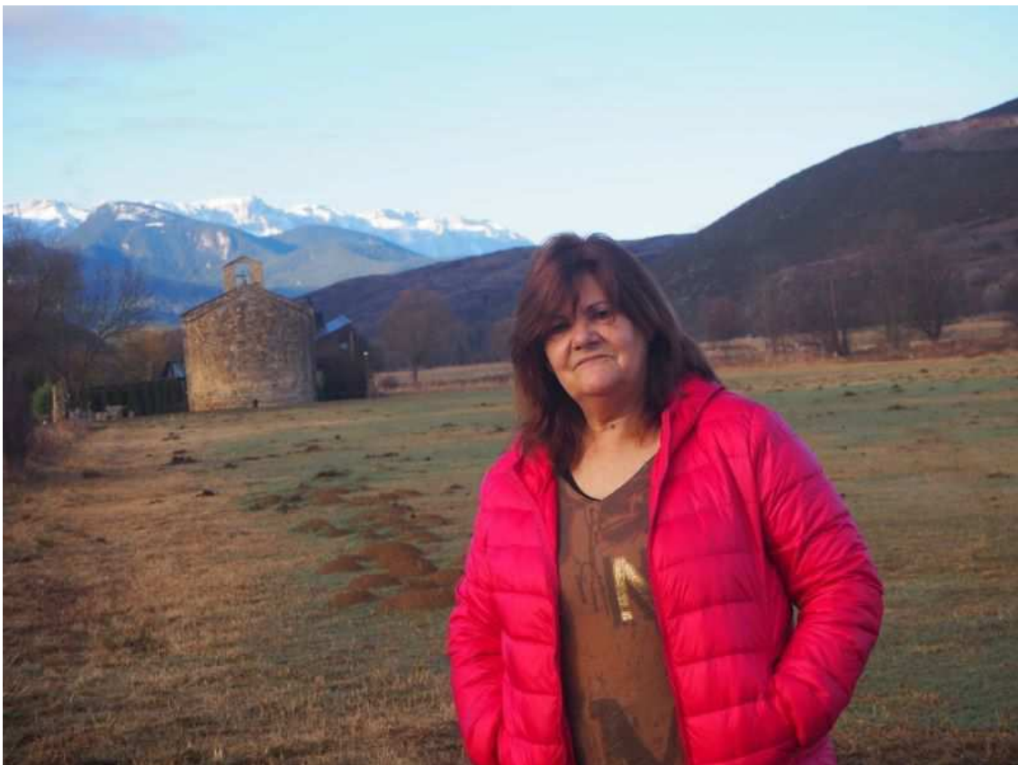
La Núria en un tram del camí.

Va ser una seqüència de fets casuals que em van semblar gairebé un miracle. Algunes associacions d'Amics del Camí de Sant Jaume de Catalunya van tenir coneixement del meu llibre i em van demanar d'anar-lo a presentar a les seves respectives poblacions. Una d'elles, els Amics del Camí de Sant Jaume de Cervera i la Segarra em van demanar, també, si els volia fer de guia des del coll de la Perxa. Ells em farien de guia a partir d'Organyà en avall, pels trams no senyalitzats. Vam estar un parell d'anys fent una sortida mensual per anar avançant i els paisatges que hi vaig descobrir em van impressionar tant que vaig pensar que s'havia d'escriure una mena de guia perquè tothom descobrís la meravella de riu i de país que tenim.