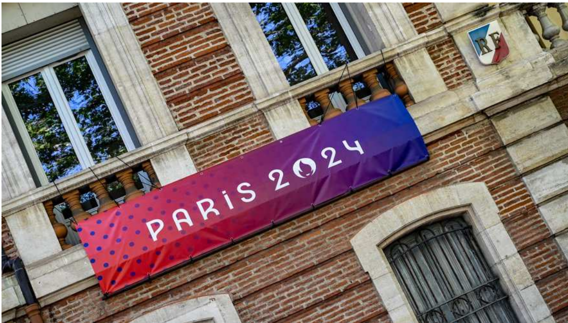
Le 15 mai prochain, les Pyrénées-Orientales accueilleront la flamme olympique.

Lors de son périple national, la flamme olympique fait escale dans les Pyrénées-Orientales le 15 mai 2024. Du sommet du Canigó aux jardins du palais des rois de Majorque, les communes se préparent à son passage.