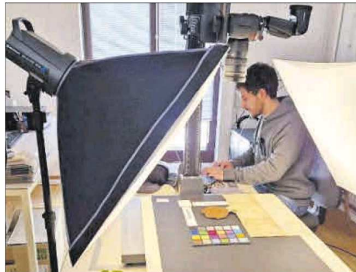
Un tècnic en el procés de digitalització dels segells

dibuixos que apareixen gravats als segells ens donen informació sobre l'emissor del document, la seva autoritat i característiques socials». Així, entre les autoritats i institucions emissores dels segells ara digitalitzats hi ha Nunó Sanç, comte de Rosselló i Cerdanya, Jaume I el Conqueridor, rei d'Aragó, Alfons X el Savi, rei de Cast-