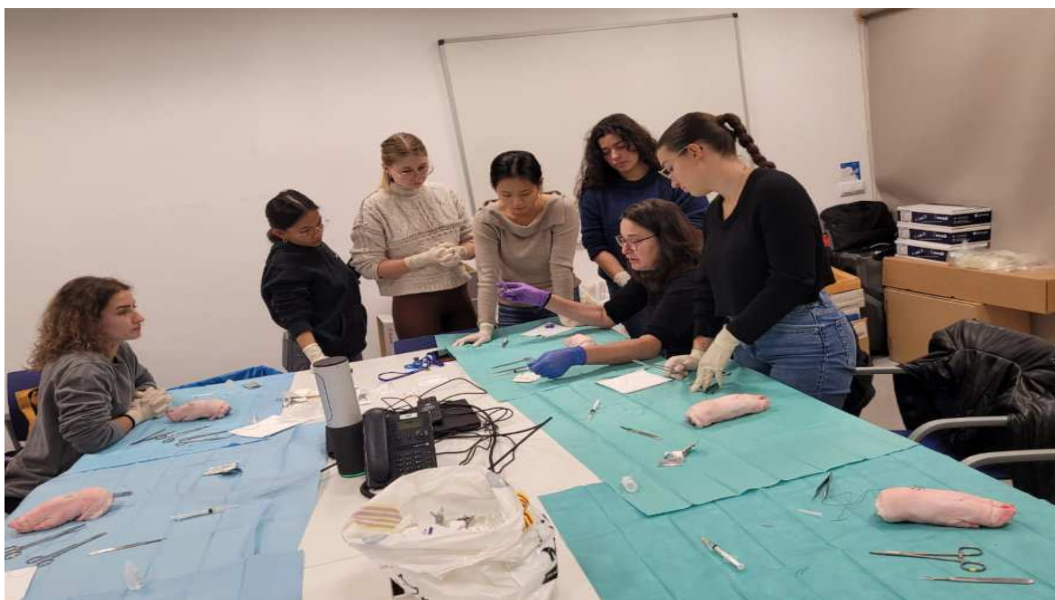
photo_camera Alumnes de pràctiques d'infermeria al Pirineu

Amb una vintena de places per a primer curs