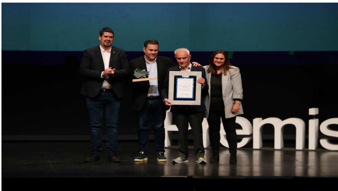
photo_camera Els propietaris de l'hotel Park Puigcerdà recollint el premi / Gemma Tubert

L'Hotel Park Puigcerdà és una empresa familiar amb cinquanta anys de trajectòria en el sector de l'hostaleria cerdana