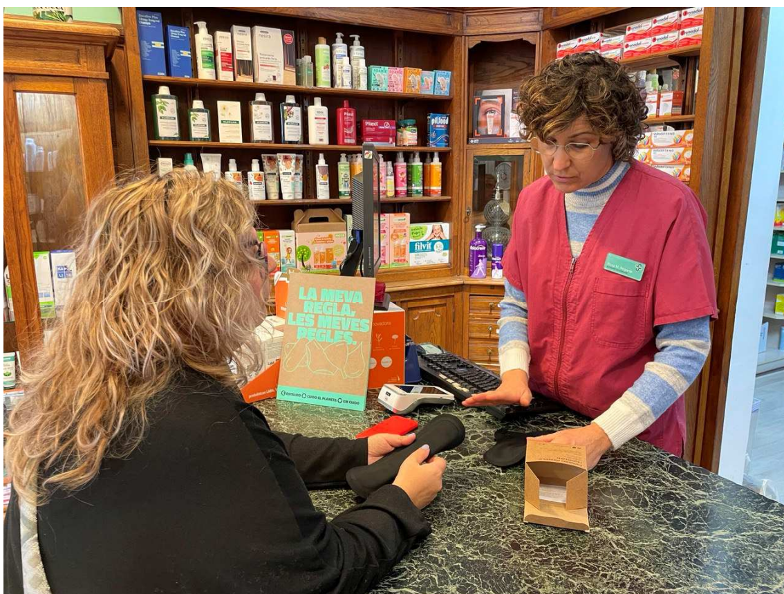
Les farmàcies de l'Alt Pirineu i Aran han dispensat de manera gratuïta productes mensuals reutilitzables

a l'Aran, 201; i a l'Alta Ribagorça, 62. A més, s'han realitzat 202 reserves de productes: 69 a la Cerdanya, 40 a l'Alt Urgell, 36 al Pallars Jussà, 25 a l'Alta Ribagorça, 19 a l'Aran i 13 al Pallars Sobirà.