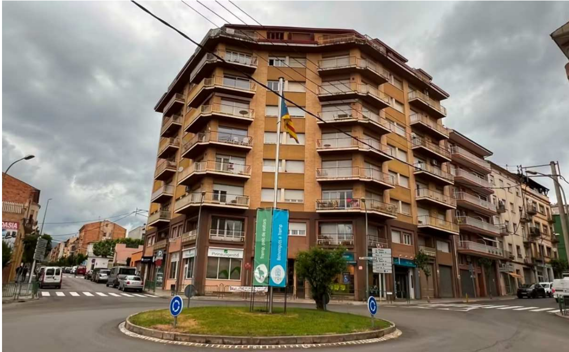
Un edifici d'habitatges a Tremp

El BOE també limita la declaració d'àrea tensionada a tres anys . Després, hi pot haver pròrrogues anuals sota la condició que es mantinguin "les circumstàncies que van motivar aquesta declaració i amb la justificació prèvia de les mesures i accions públiques adoptades per revertir o millorar la situació des de l'anterior declaració".