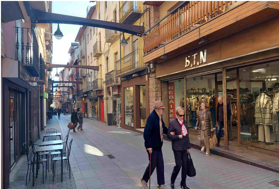
Imatge del carrer Major de Puigcerdà / Feliu Sirvent