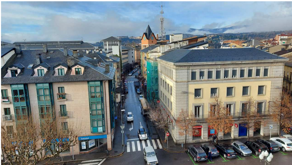
photo_camera La Seu Plaça Catalunya

El document publicat aquest divendres al BOE recull els criteris que fixa el topall