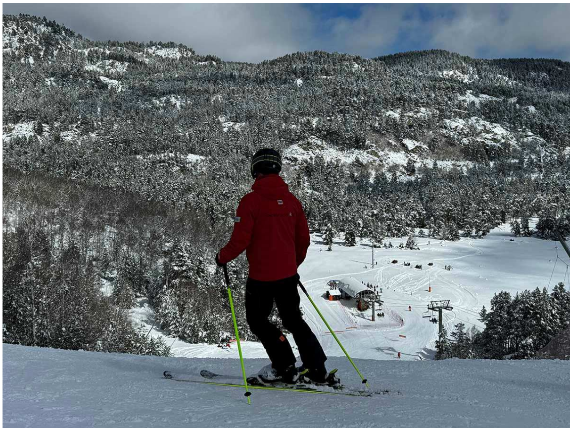
Observant el telecadira i pla dels Aveillans.

Una bona notícia per a Font Romeu i per a tot el Pirineu, que d'aquesta manera s'aconsegueix encarar el tram final de la temporada en condicions molt bones. Qui no volia esquiar perquè les condicions no eren de neu pols o de paisatges blancs, ja no té excusa.