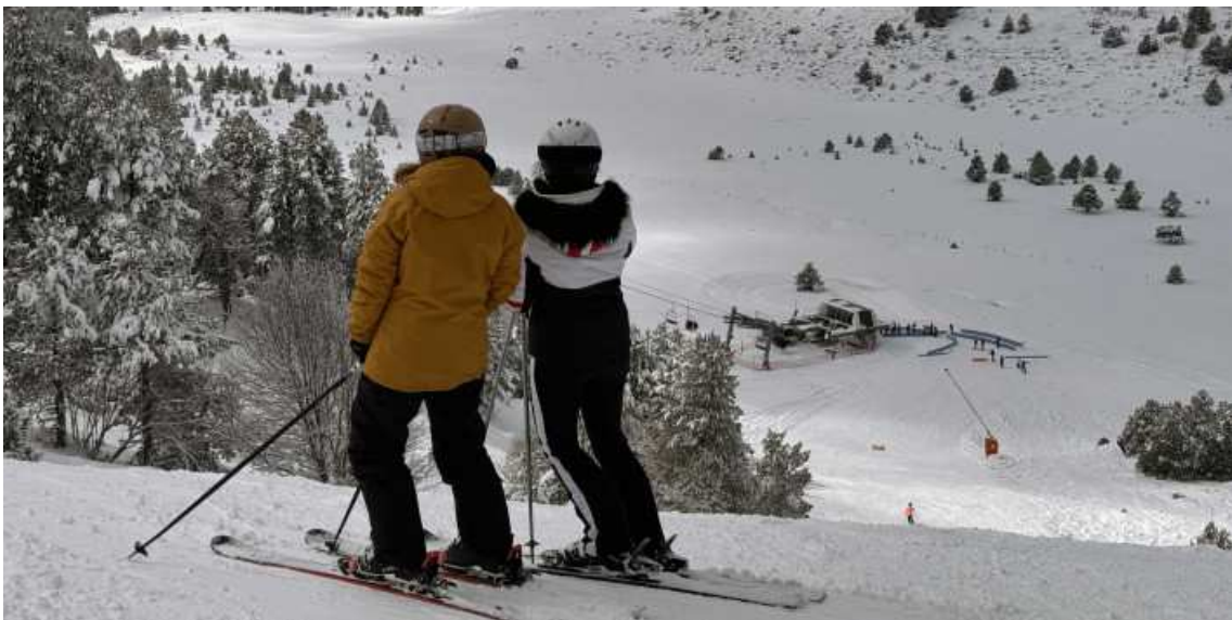
Dues esquiadores a la pista Pradeilles, a la cara nord de Font Romeu

Fins a 40 cm de neu pols humida que garanteixen el tram final de la temporada en condicions de "tot obert"