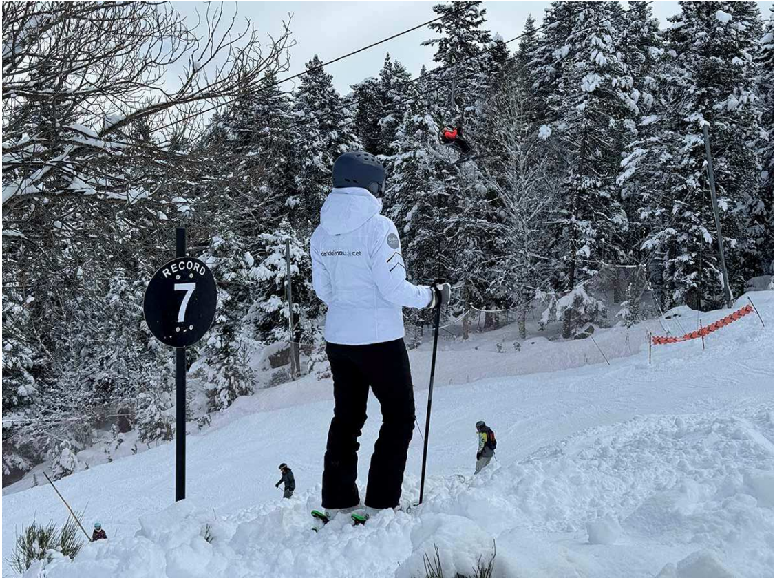
Pista Record aquest matí. Una negra que avui, gràcies a la neu pols, era "dominable" per a gairebé qualsevol esquiador.