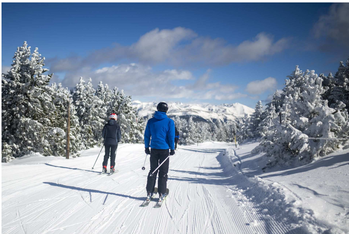
Port Ainé ha abierto sus itinerarios

Las seis estaciones de esquí de FGC encaran con mucho optimismo esta recta final de temporada. La cantidad y calidad de nieve , las previsiones meteorológicas a corto plazo y la proximidad de la Semana Santa confirman que este mes de marzo reúne los ingredientes necesarios para disfrutar de los deportes de invierno y exprimir al máximo un final de temporada cargado de eventos en todos los equipamientos turísticos.