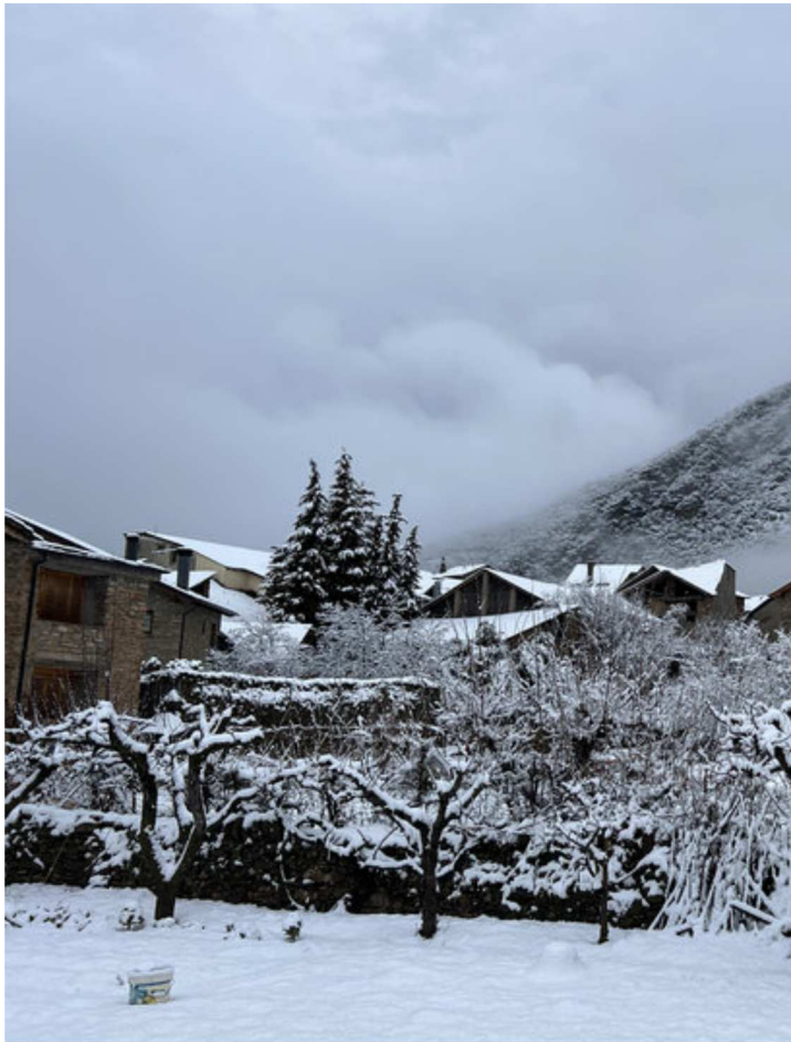
Neu a Altron ACN.