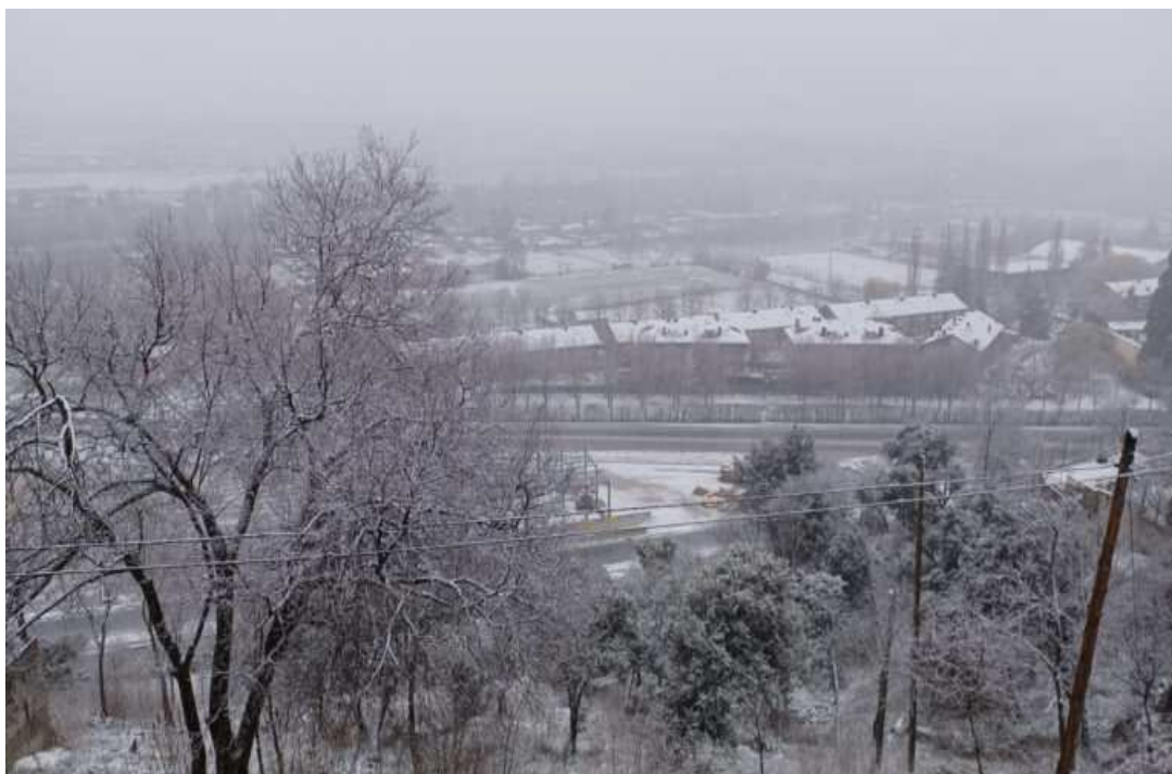
Vista de la Seu d'Urgell des del barri del Poble Sec (Les Valls de Valira)/P.D.

Trànsit informa de l'obligatorietat de circular amb cadenes