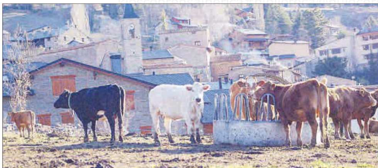
Un ramat de bestiar boví al voltant de la menjadora al limit urbà de Prullans

vaques. Pel que fa als cavalls, un altre símbol de la Cerdanya, la xifra d'explotacions ha experimentat un descens del 49%, passant de les 149 explotacions de l'any 2000 a les 73 actuals. Amb tot, el cavall és en moltes cases un animal que es té més per tradició que no pas per negoci.