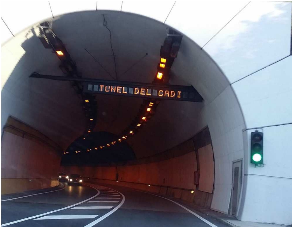
Túnel del Cadí

El compromiso lo ha adquirido a finales de la semana pasada la Consellera de Territori de la Generalitat, Ester Capella , ante los alcaldes del Berguedà afectados -Berga, Cercs, la Nou de Berguedà, Sant Julià de Cerdanyola, Guardiola de Berguedà y Bagà-, aunque habrá que ver por aquellas fechas quien está al frente del Gobierno catalán, hay unas elecciones autonómicas de por medio y si sus resultados tienen alguna repercusión sobre la ejecución de dicho proyecto.