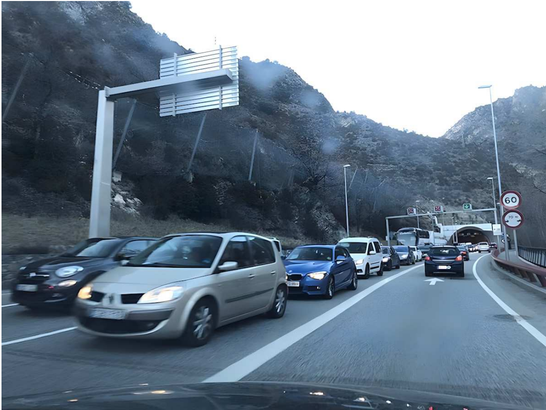
Eje del Llobregat con las habituales colas.

La Generalitat anuncia la ampliación del tramo entre Berga y Bagà empezará a finales del 2025 para estar lista el 2030.