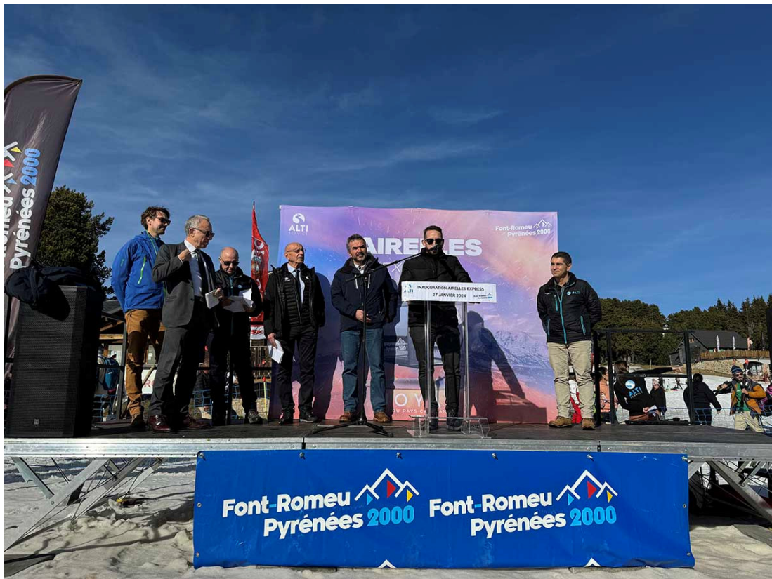
Acte institucional a Les Airelles.

Després del tall de cinta oficial i uns breus parlaments, el seguici de prop de 200 persones ha pujat amb el telecabina fins a la terminal superior de Les Airelles, a 1.965 metres. Davant el xalet de Les Airelles, i a l'exterior i en un ambient festiu, s'han fet els parlaments oficiosos per part de les autoritats i s'han fet els reconeixements a totes les parts implicades en la construcció, des d'equips tècnics, fins a autoritats, així com responsables d'administracions, equips que han supervisat la seguretat o proveïdors directes de la instal·lació, entre els quals el principal, la constructora Leitner.