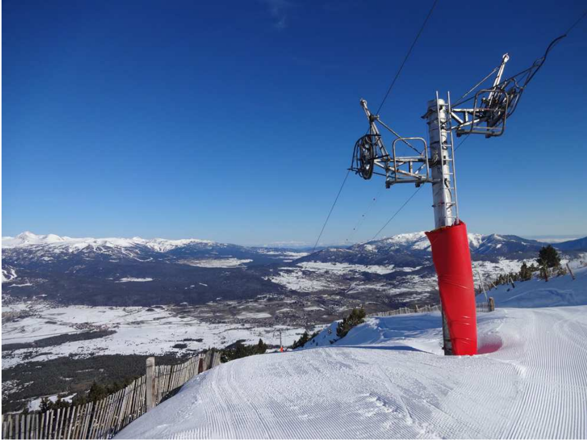
Cota alta de Cambre d'Aze en una imagen de archivo.

acuáticas en verano (aún por definir) y ayudará a abastecer a los ganaderos de la Alta Cerdanya y a los municipios de Eyne y Saint Pierre dels Forcats en caso de sequía o a los bomberos para apagar incendios.