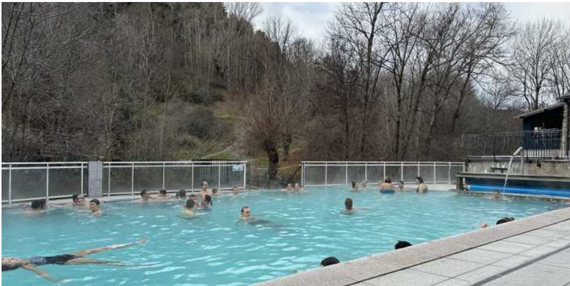
Après-ski de banys termals a l'Alt Conflent, Alta cerdanya i Capcir. A la imatge, Llo.

Quatre propostes per al relaxament després d'un dia a l'alta muntanya