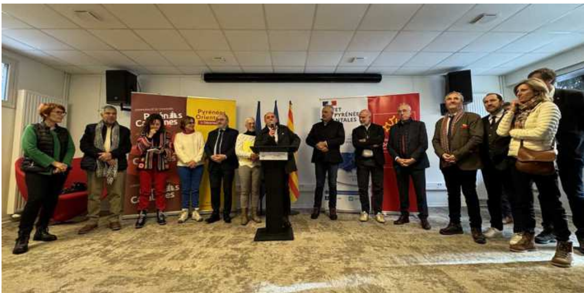
Així va celebrar Les Angles el seu 60è aniversari

Celebrada el passat 6 de gener de 2024, amb diverses inauguracions i una festa en homenatge al fundador de l'estació d'esquí