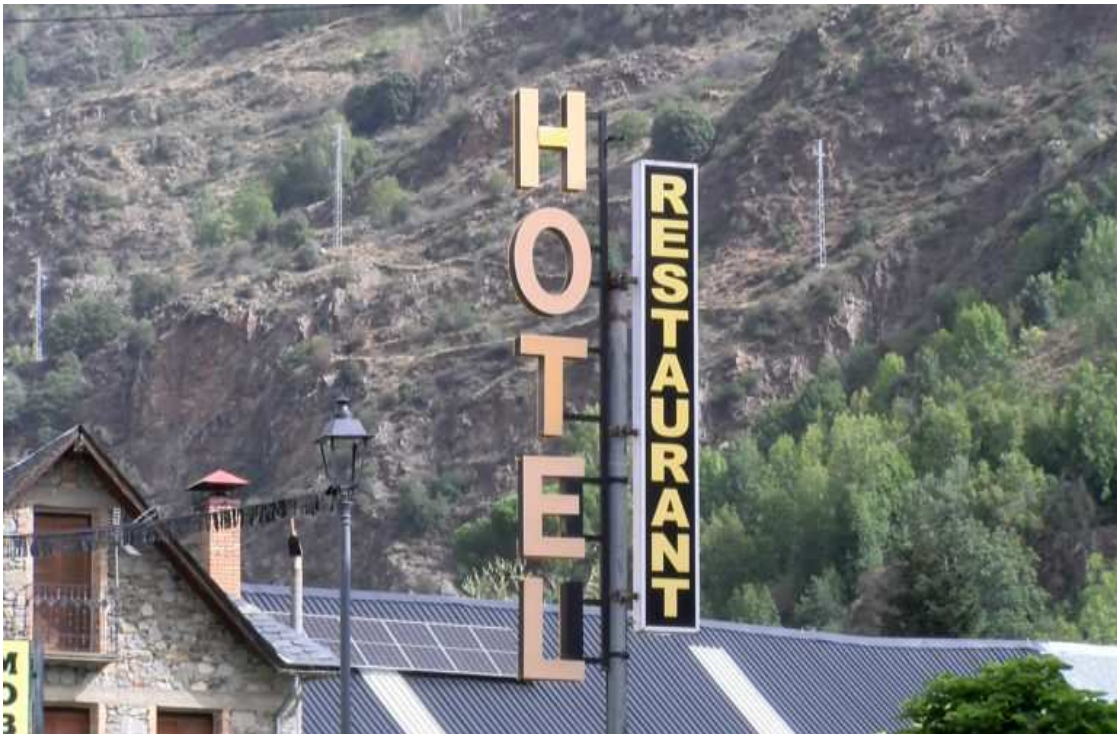
Cartell d'un hotel d'Esterrí d'Àneu.

L'Alt Urgell és la tercera comarca catalana amb més sector terciari i la Cerdanya la primera en construcció