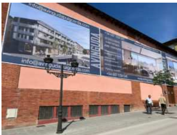
Façana del cinema Avinguda de Puigcerdà, amb l'anunci dels pisos que s'hi faran. / M.F.C.

Per comarques, destaca precisament el creixement dels serveis a l'Alt Urgell, on s'han produït 36 milions d'euros més d'activitat econòmica que l'any anterior en aquest àmbit. Això fa que passi a ser la primera comarca pirinenca i la tercera de Catalunya amb un pes major d'aquest sector, només per darrere del Barcelonès (87,4%) i el Garraf (82,9%). Just per sota trobem la Cerdanya, on els serveis ocupen el 79,8% de l'economia. Les altres zones de l'Alt Pirineu on l'increment dels serveis ha sigut més pronunciat han estat el Pallars Jussà i el Pallars Sobirà, amb pujades de 4,9 i 4,7 punts, respectivament.