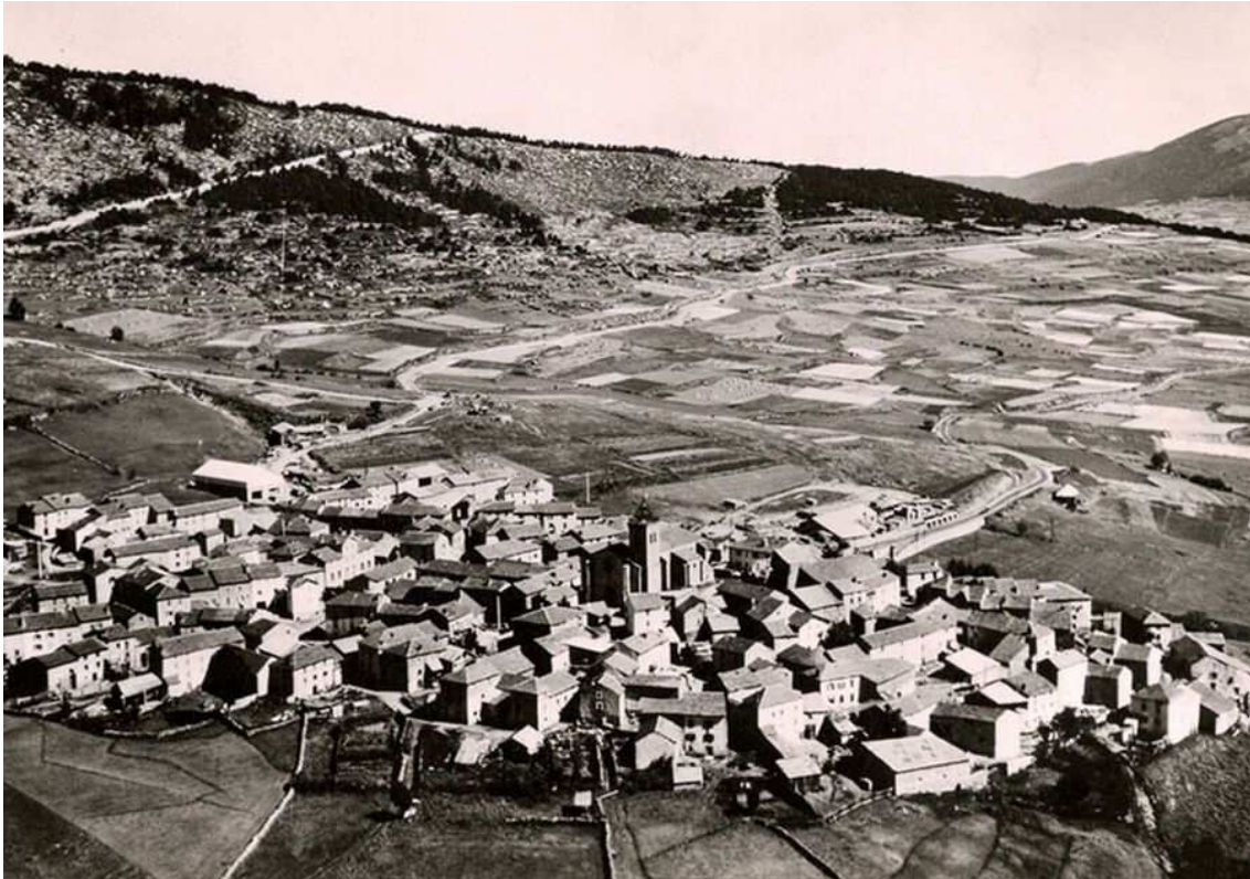
El pequeño pueblo de Les Angles en los años '60

Pronto se dio cuenta de que tenía ante sí el futuro de su pueblo, el antídoto contra el éxodo rural que azotaba duramente a las zonas de montaña y contra la despoblación que traería consigo. Se lanzó a buscar financiación entre los bancos , que al principio se mostraron muy reacios, y acudió entonces a la prefectura , que tampoco tenía mucha confianza en sus esfuerzos.