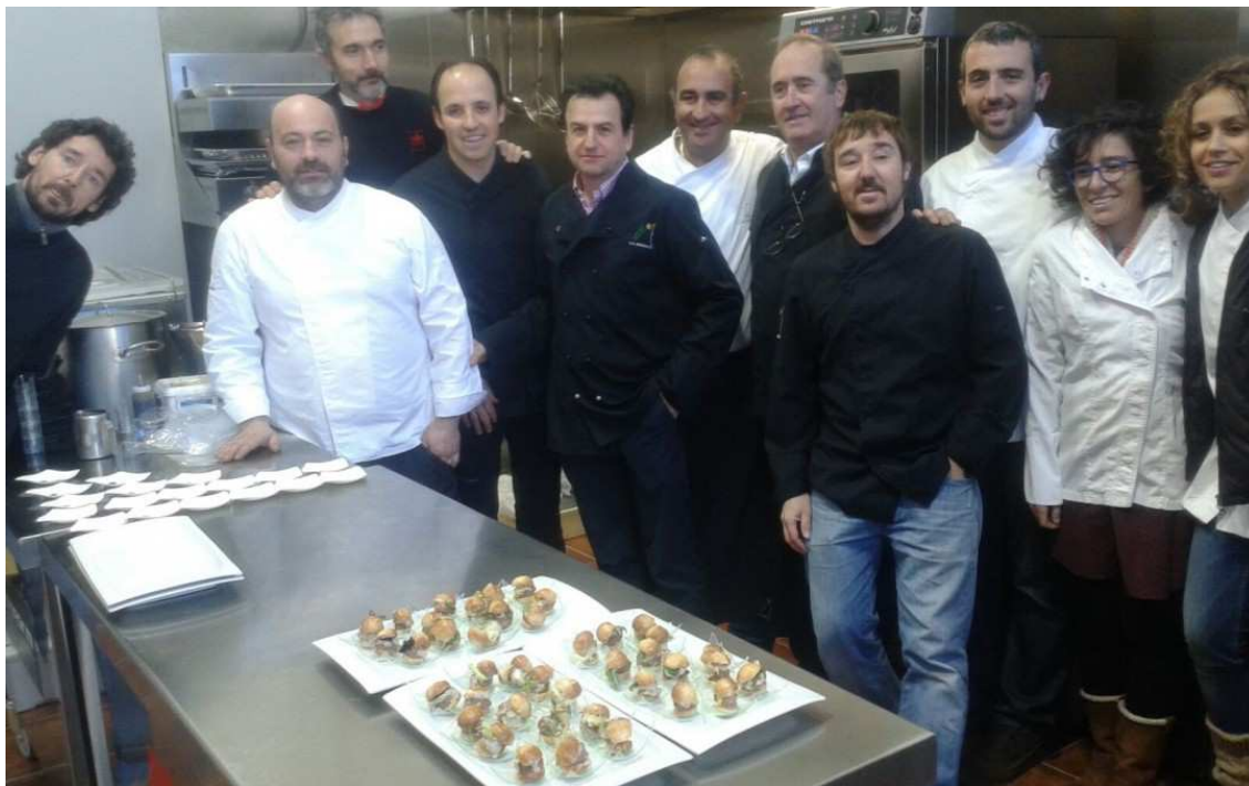
El projecte de l'Aula de Cuina de Sort ha estat promogut pel Consorci LEADER Pirineu Occidental

Els ajuts destinats a aquesta convocatòria tenen caràcter de cofinançats pel Fons Europeu Agrícola de Desenvolupament Rural (FEADER) , i aniran a càrrec d'una partida pressupostària del Departament, dotada amb un import màxim de 3.990.000 euros, el que suposa el 57% del finançament; i la resta, 3.010.000 euros, anirà a càrrec del FEADER.