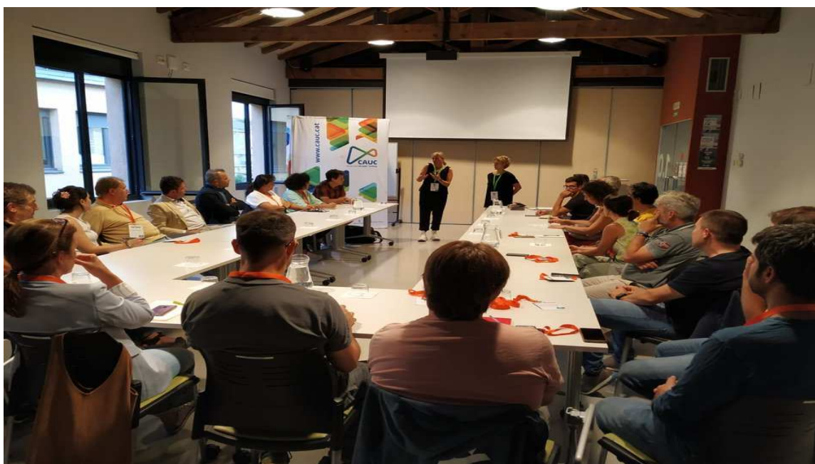
photo_camera Una reunió amb empreses del territori leader de l'Alt Urgell i la Cerdanya

El termini de presentació de sol·licituds finalitzarà el pròxim 20 de gener.