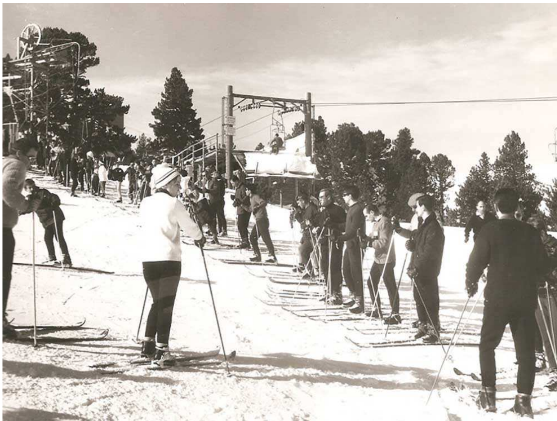
Els Angles als anys 60

Sembla ser que els requisits aviat els va afrontar i els va tenir superats, perquè pel dia de Nadal de 1963 s'inaugura el primer hotel del poble: l'Hôtel Lletet.