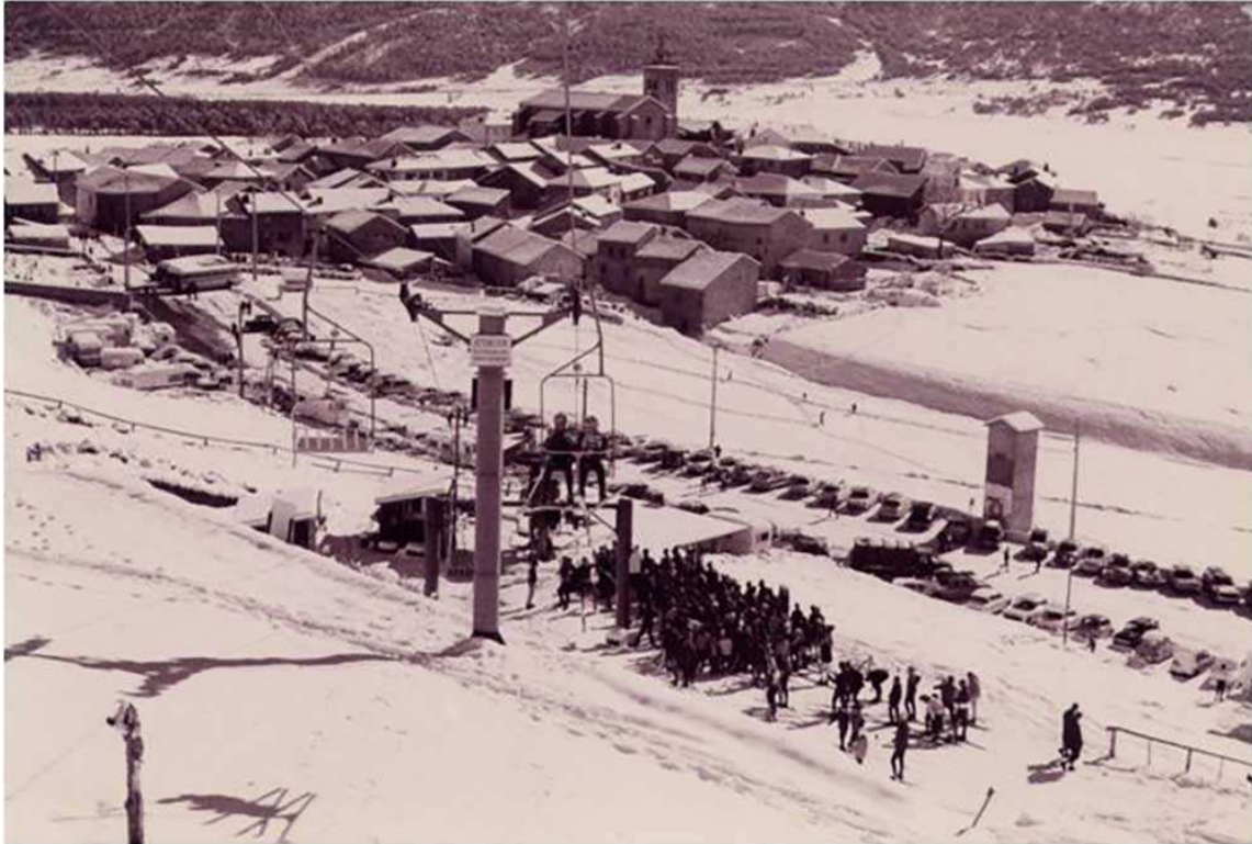
El poble de Les Angles al fons i el telecadira Jassettes l'any 1966 (Foto: web les pyrenees orientales).

Per a la compra del primer telecadira es va demanar un crèdit als bancs de 116 milions de francs, una xifra que es considera descomunal per a un ajuntament amb un pressupost de poc més de 2 milions de francs anuals. L'Ajuntament avala l'operació amb els boscos de propietat municipal, entre els quals el bosc de la Mata.