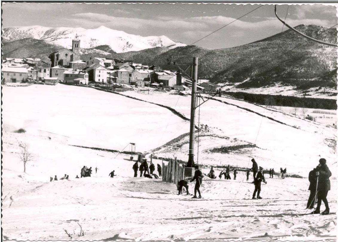
Les Angles, poble i teleesquí, en una fotografia dels anys 60-70. No es concreta any.

En arribar als 70, en concret el 1970, es posa en marxa el primer telecabina de l'estació, sent el primer de tot el Pirineu oriental de França. Es tracta de Les Pèllerins, de quatre places, amb accés fins a l'altiplà de Bigorre.