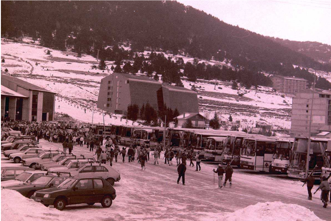
Aparcament del peu de pistes del telecabina. Pel tipus de vehicles, es creu que podria ser una fotografia de la temporada 1983-84 (Foto: cedida per Oficina de Turisme de Les Angles).

La nevada del 30 de gener de 1986 és recordada com la més voluminosa Les Angles, ja que els veïns del poble es veuen obligats a sortir de casa seva pel balcó.