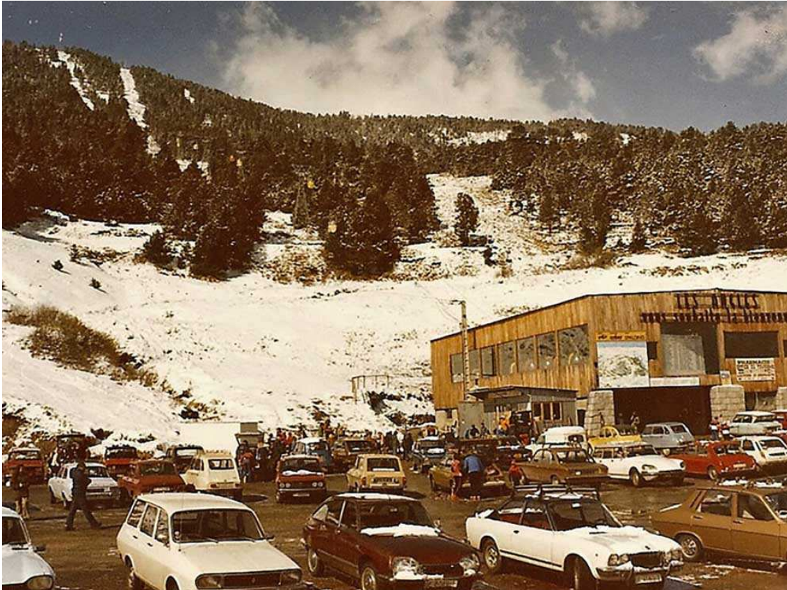
Els Angles als anys 70 (Foto: autor desconegut - Obtinguda del magazine Boudou).

El 1975 es posa en marxa el primer centre de vacances "Manéou".