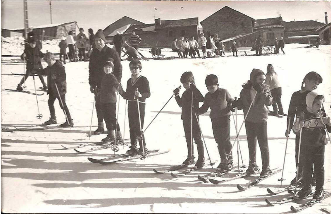
Nens i nenes al poble de Les Angles als anys 60. No es concreta any.

La zona de Les Angles, a les falades del Roc d'Aude (2.325 m) i del Mont Llaret (2.373 m) ja havia estat identificada i assenyalada l'any 1932 com a molt adient per a la construcció d'un centre d'esquí per François Mermet. Avui una pista porta el nom d'aquest conegut militar francès, el famós mur Mermet, una negra que impressiona per la seva amplada i desnivell.