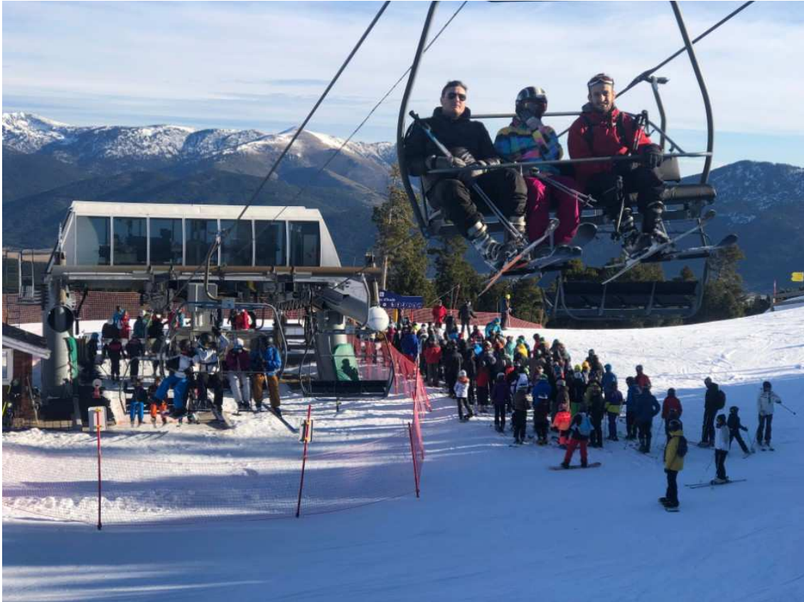
Telecadira Roc d'Aude.

El 1991, aquell vell primer telecadira de l'estació de dues places, instal·lat el 1964, queda substituït pel que serà el primer telecadira desembragable de 4 places de Les Angles, el Jassettes Express, instal·lat per de Doppelmayr. Aquest mateix es posa en marxa el primer snowpark.