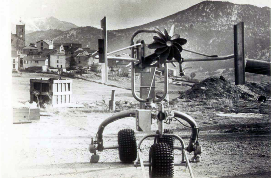
El primer canó de neu que arriba a Les Angles. No es concreta any però pel seu aspecte podria ser de finals dels 60 o inicis dels 70.

Durant la temporada 1968-69 l'estació s'expandeix cap al Pla del Mir, tot i que altres fonts daten aquesta expansió en l'any 1973.