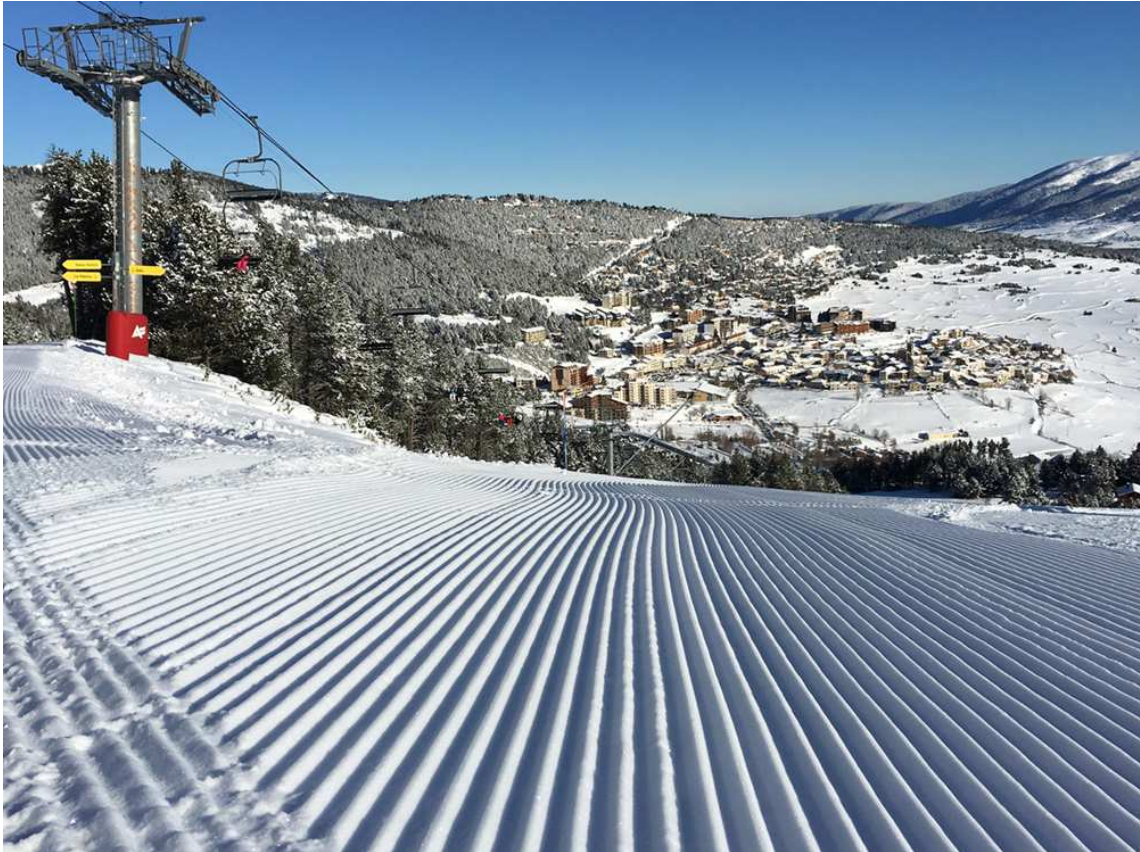
En primer terme la pista Baliu. A l'esquerra el telecadira del mateix nom. Al fons el poble de Les Angles.

L'estiu de 2007 es posa en marxa el bike-park, actualment un dels tres referents del Pirineu oriental.