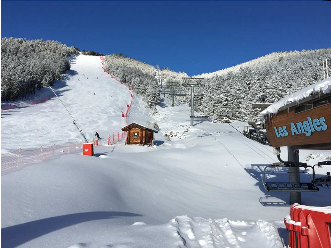
Telecadira Pla del Mir, en una imatge d'arxiu (Foto: Diaridelaneu).

L'any 2006, la traça i pista de Baliu, després de 24 anys d'inactivitat, es recupera i s'hi instal·la l'actual telecadira fix de 4 places.