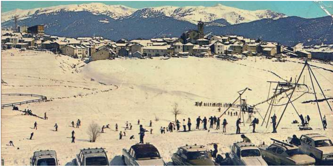
Postal de Les Angles anls anys 70 Autor/a: Dino

Un recull complet del desenvolupament de l'estació i dels esdeveniments històrics més importants entre 1964 i 2024