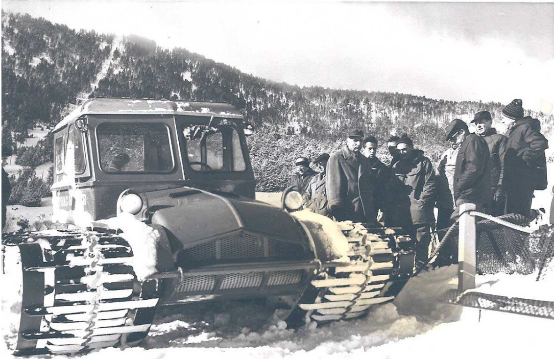
Trepitjaneus a Les Angles als anys 60. No es concreta any (Foto: Oficina de Turisme de Les Angles).

El 1968 es posa en marxa el telesquí Sant Pere, al vessant sud d'aquest cim. Aquest mateix any, en el qual se celebren els Jocs d'hivern a Grenoble, la flama olímpica passa pels Angles. Aleshores el preu del forfet/dia/adult era de 16 francs.