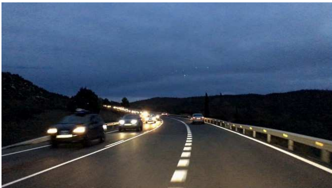
Colas en la C14 en un domingo de Puente.

Otra opción para los que regresan de Andorra -incluso para desesperados desde Puigcerdà y la Cerdanya- es desviarse en la Seu d'Urgell por la C-14 y C-55 hacia Solsona, Suria y Manresa, donde confluyen con sus paisanos que vienen de la C-16 ya transformada en E-9. El recorrido es más largo, pero el tráfico puede ser más fluido. Además te ahorras el peaje del túnel.