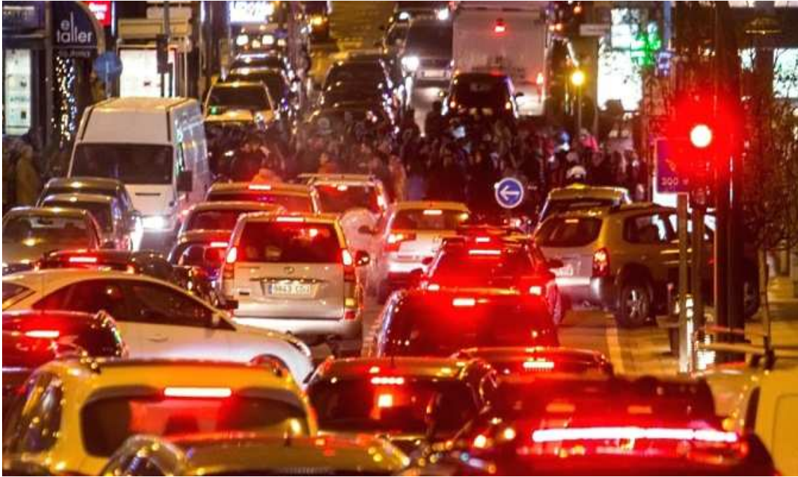
Imagen de archivo Andorra

El Servei Català de Trànsit cifra en más de 460.000 el número de vehículos que salieron de Barcelona y su área metropolitana entre el miércoles y el viernes y ahora todos ellos, además de los de otras provincias, deben regresar a sus casas.