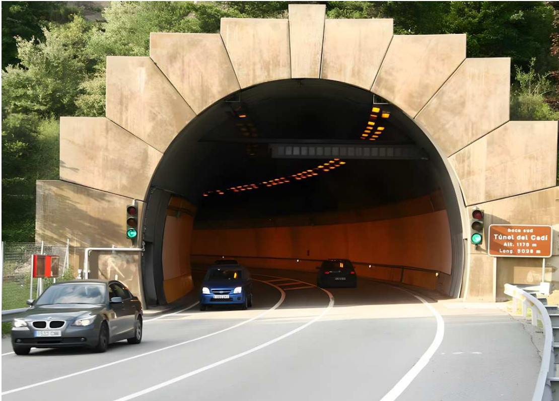
Boca sur de Túnel del Cadí.

Unos 460.000 vehículos vuelven este domingo al área metropolitana de Barcelona, la mayoría procedentes de Andorra y la Cerdanya.