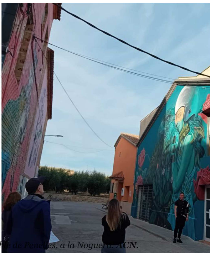
El pont de Penelles, a la Noguera.