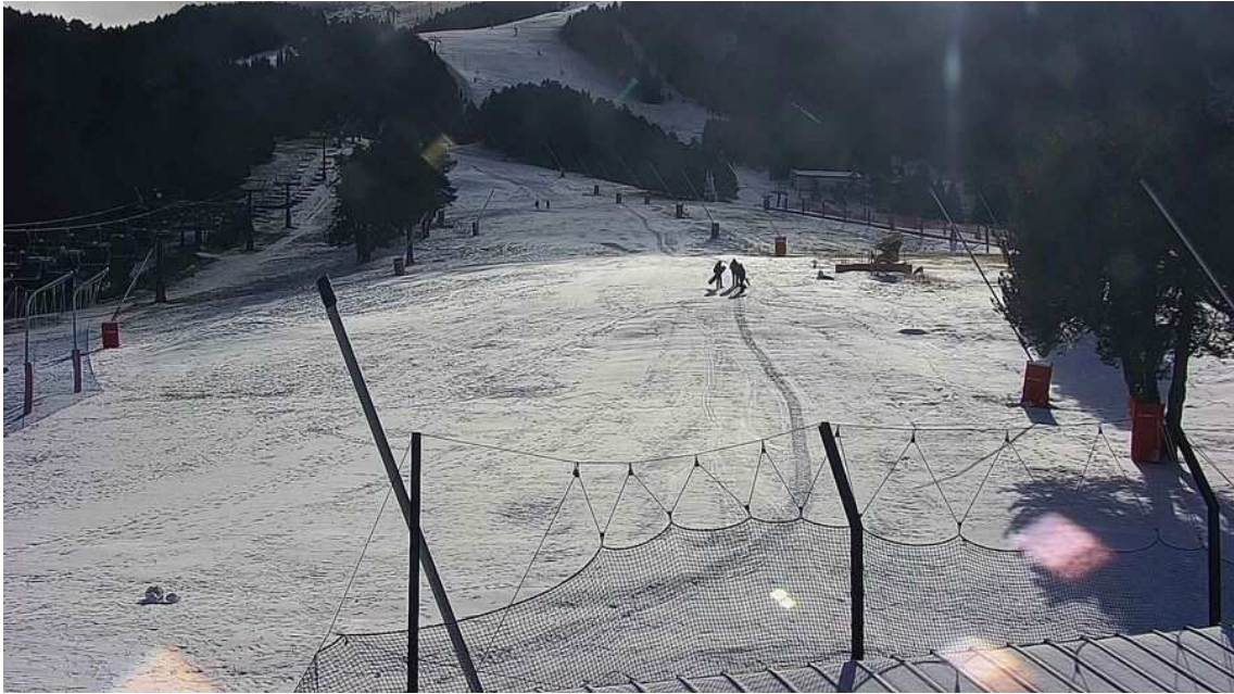
La Molina abrirá Pista Llarga