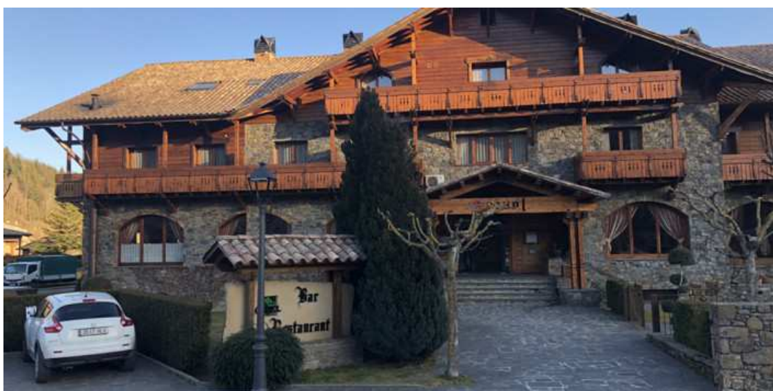
Amb neu o sense, el Pirineu de Girona al 75% per al pont de la Constitució

Una temporada d'esquí "incerta" per al Pirineu de Girona