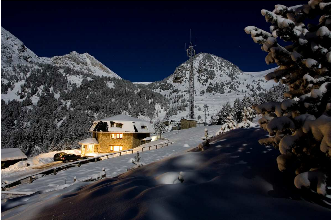
Hostal Pastuira a Setcases-Vallter.