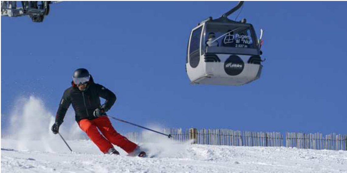
Practicant esquí alpí a La Molina

Desglossem una a una les millores que ofereixen aquest hivern