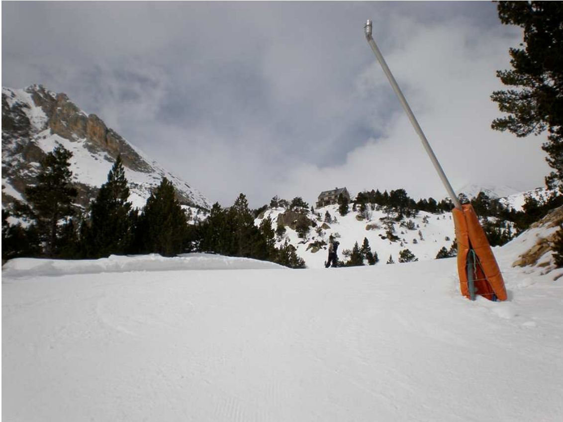
Pista el Xalet de Vallter en una imatge d'arxiu (Foto: DDLN).