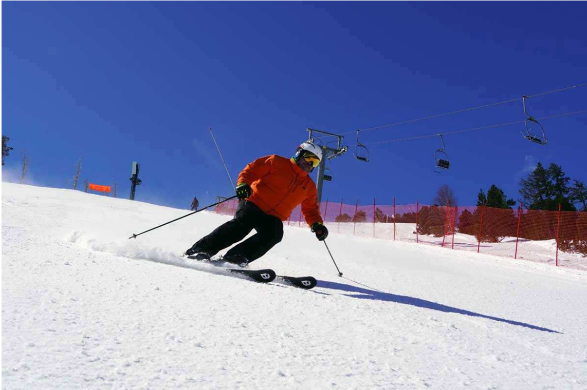
Esquiant per l'Estadi d'Espot.