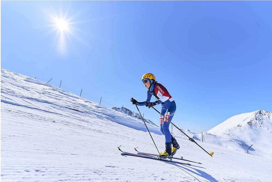
Una de les imatges que ens va deixar la prova Vertical dels ISMF Skimo World Championships 2023 (Liquen Studio).