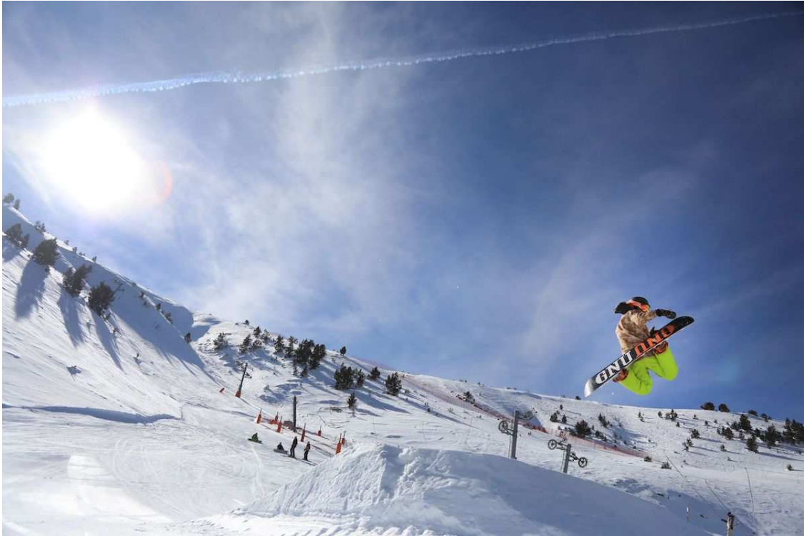
Gaudint de l'snowpark de Port Ainé.