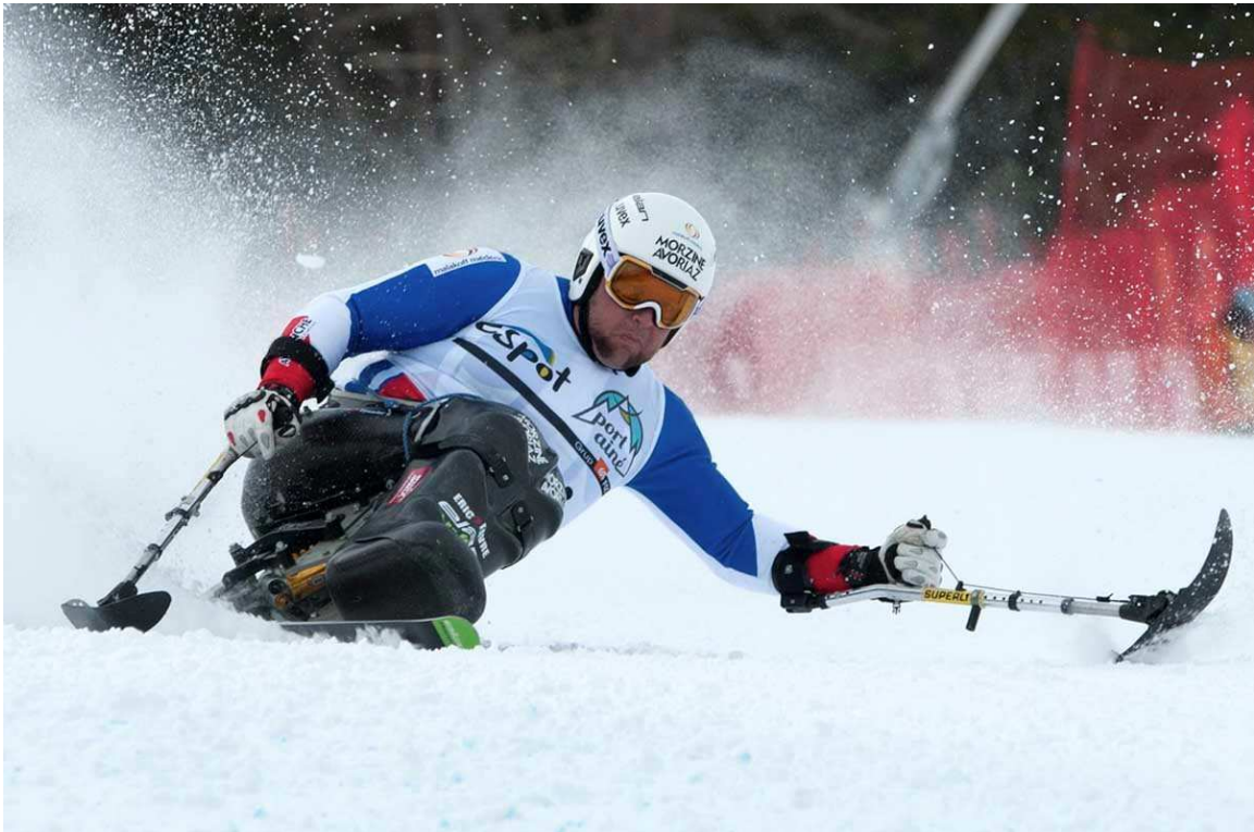
Una de les imatges que ens van deixar els campionats FIS Para AlpineSki celebrats a Espot l'hivern passat.

Torna la competició internacional d'alt nivell a l'estació de la Cerdanya. I és que La Molina sempre ha estat referent en esport blanc adaptat. La pista Barcelona i l'estadi de competició "Lluís Breitfuss", reobertes al públic l'hivern passat després de ser remodelada, serà seu de les proves de velocitat de la Copa del Món de Para Esquí Alpí del 13 al 17 de gener, amb dos descensos i un supergegant. Més informació en aquest enllaç.