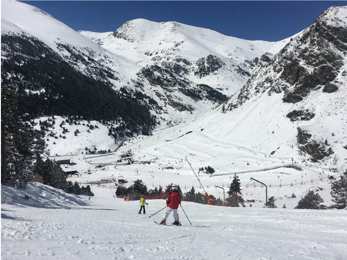
Esquiadors per la pista Mulleres de Vall de Núria (Foto: IST).