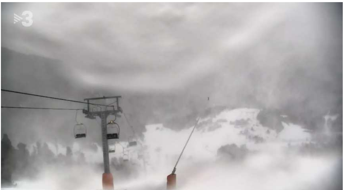
Episodi fort de torb a Espot

A causa de la precipitació important de neu que es preveu fins dimecres al migdia al vessant nord del Pirineu, hi haurà la possibilitat del fenomen del torb. Així mateix, es preveu fort onatge (maregassa) a les comarques de l'Alt i Baix Empordà, sobretot a partir d'aquesta dimarts a la nit i fins dimecres. La direcció de l'onatge serà de nord-est i hi haurà mar de fons.