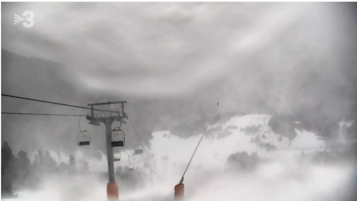
photo_camera Episodi fort de torb a Espot viurealspirineus

El component del vent serà nord i afectarà sobretot cotes altes del Pirineu