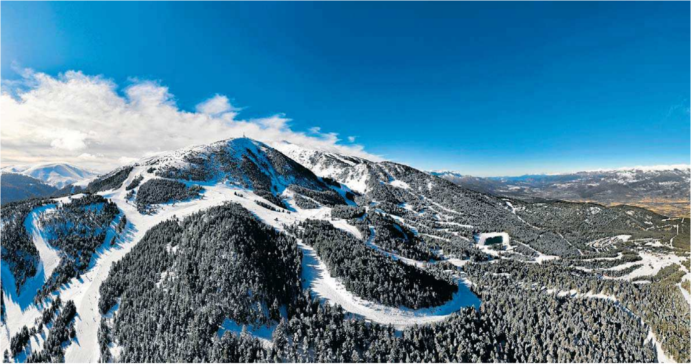
Les pistes d'esquí de La Masella (la Cerdanya). LA MASELLA