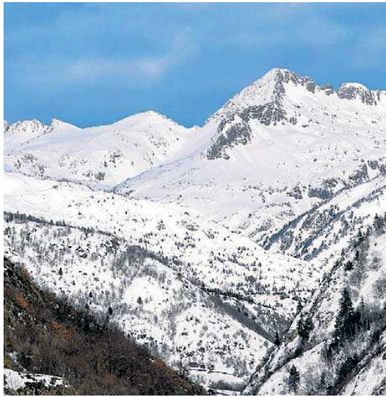
Tavascan, després d'una gran nevada.

L'entranyable estació de Tavascan treballa per incorporar, els anys vinents, els primers canons de neu produïda