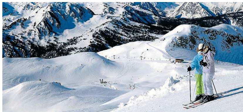
Baqueira Beret (la Vall d'Aran). BAQUEIRA BERET

Amb un abonament que permet esquiar més de 100 dies en 50 destinacions de neu d'arreu del món, La Masella obre temporada amb una botiga en línia més àgil i pràctica per a la tramitació dels forfets i altres ser-