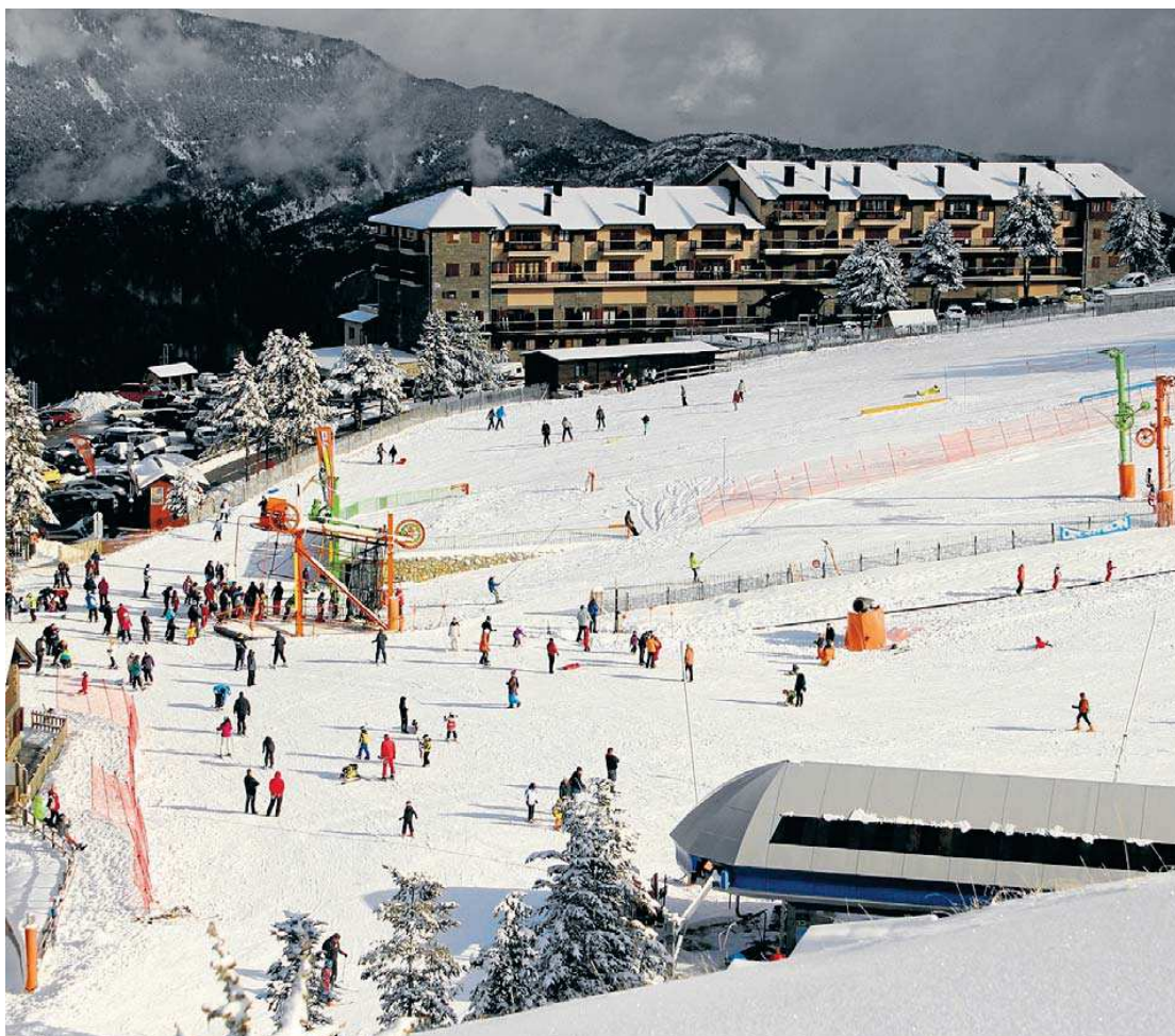
L'estació d'esquí del Port del Comte (Solsonès). PORT DEL COMTE