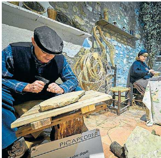
Un dels antics oficis que podem veure. JORDI SANTACANA

Un any més, la Masia Castelló, aquest petit nucli del municipi de Vandellòs i l'Hospitalet de l'Infant, acollirà un dels pessebres vivents més singulars de Catalunya, el Pessebre dels Estels, que arriba a la 26a edició. Les representacions tindran lloc els dies 8, 9, 16 i 17 de desembre i tornaran a omplir el poble d'escenes bíbliques i d'antics oficis, amb algunes novetats. Una d'elles és l'ampliació d'horari, enguany, des de les cinc de la tarda, per tal d'acostar-lo a les famílies amb infants més petits. L'altra novetat és que les primeres 1.000 entrades es posen a la venda a un preu més reduït a través de la pàgina web www.masiacastello.cat/entrades-del-pessebre . El preu reduït és de 10 euros per als adults i 6 euros per als infants. Un cop exhaurides les mil primeres unitats, els preus seran els següents: adults, 12 € (més grans de 10 anys); infants, 7 € (de