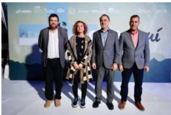
Les autoritats, durant la presentació de la temporada d'hivern 2023-2024.

Ferrocarrils ha creat el Servei d'Observatori de l'Impacte Econòmic, Ambiental i Social de les seves explotacions turístiques per mesurar com incideix la seva activitat en el territori. D'aquesta manera es pot copsar l'efecte de dinamització socioeconòmica d'FGC a les comarques d'ubicació i calcular el retorn social i econòmic de la inversió pública.