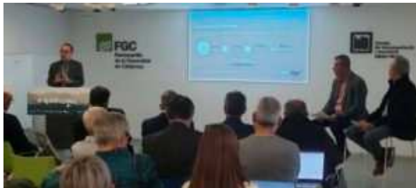
Un moment de la presentació de la temporada d'hivern d'FGC.

mntanya i en aquesta presentació ho evidenciem una vegada més. És un actiu per al desenvolupament territorial, fonamentalment del Pirineu, un territori amb unes condicions especials i unes necessitats específiques. FGC té un paper clau en la dinamització econòmica i social, un paper que exercim 365 dies a l'any”.