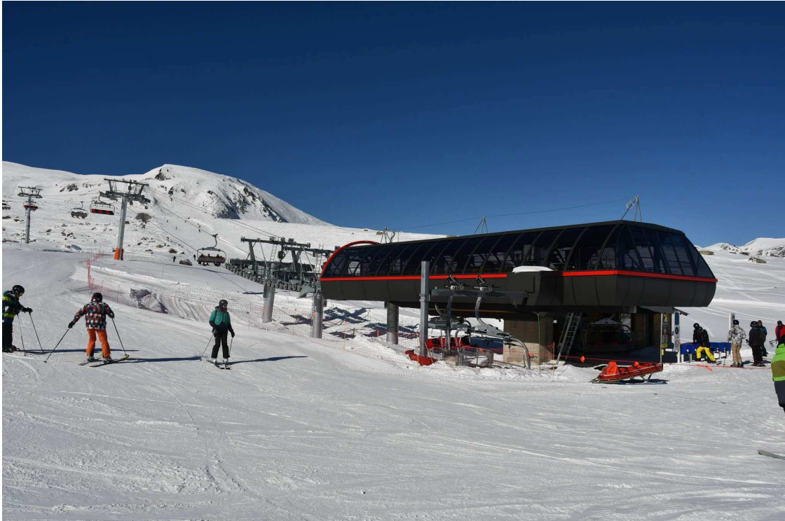
El nuevo telesilla de La Mine de Porté ha sido la estrella de los remontes del pasado invierno en Trio-Pyrénées.

El forfait conjunto de Porté Puymorens, Formiguères y Cambre d’Aze sigue siendo uno de los más competitivos del Pirineo, a pesar de que ha subido 16 euros el de adulto y 30 euros el infantil en comparación con el año pasado.