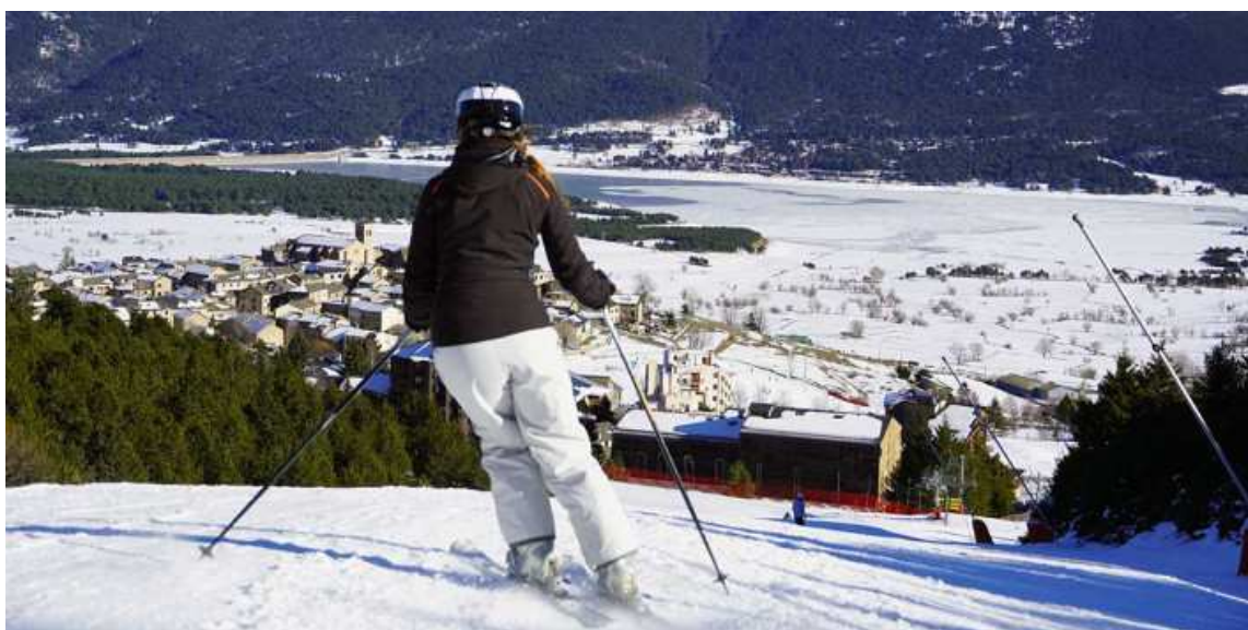
Les Angles posa a la venda el seu forfet de temporada amb descompte

Fins al 3 de desembre permet un estalvi del 15%, a més d'ofertes especials per a famílies i estudiants