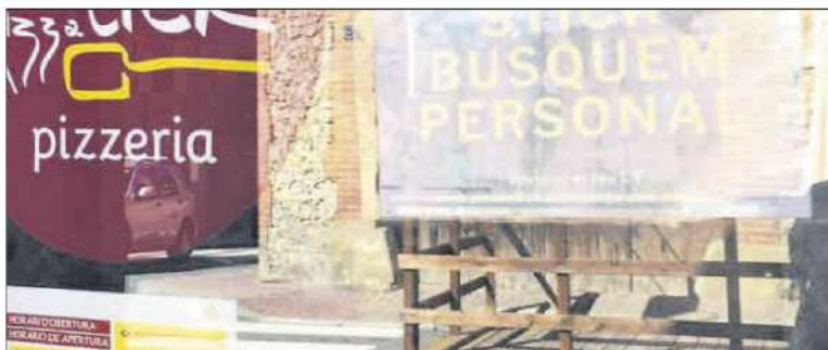
Cartell demanant personal en un establiment de restauració

set. La gran majoria de les ofertes, a més, són per temporada ja que així ho requereix l'actual estacionalització en campanyes de neu i estiu, de manera que encara resulta més complicat pels temporers de trobar un habitatge en un parc comarcal el 63% del qual és de segona residència.