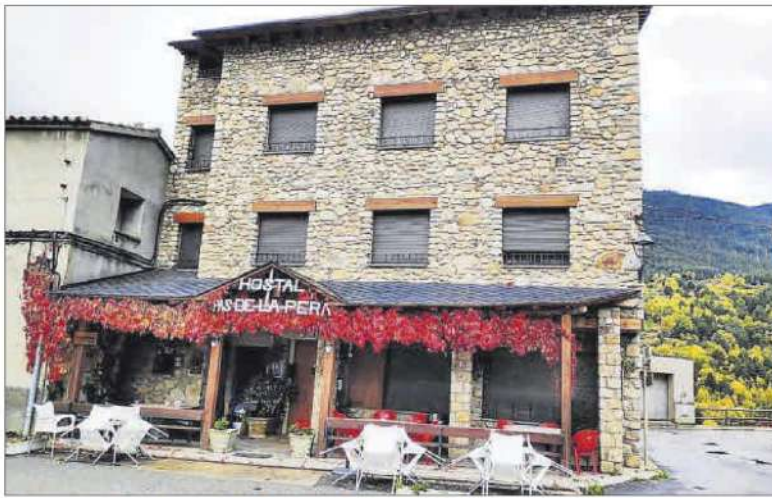
L'Hostal del Pas de la Pera d'Arànsers al terme municipal de Lles de Cerdanya

► L'Hostal del Pas de la Pera es veu obligat des de fa quatre anys a afegir un habitatge al contracte de treball per als temporers