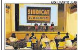
Una reunió del SHC

► Un moviment social a la vall treballa en paral·lel als empresaris i les administracions