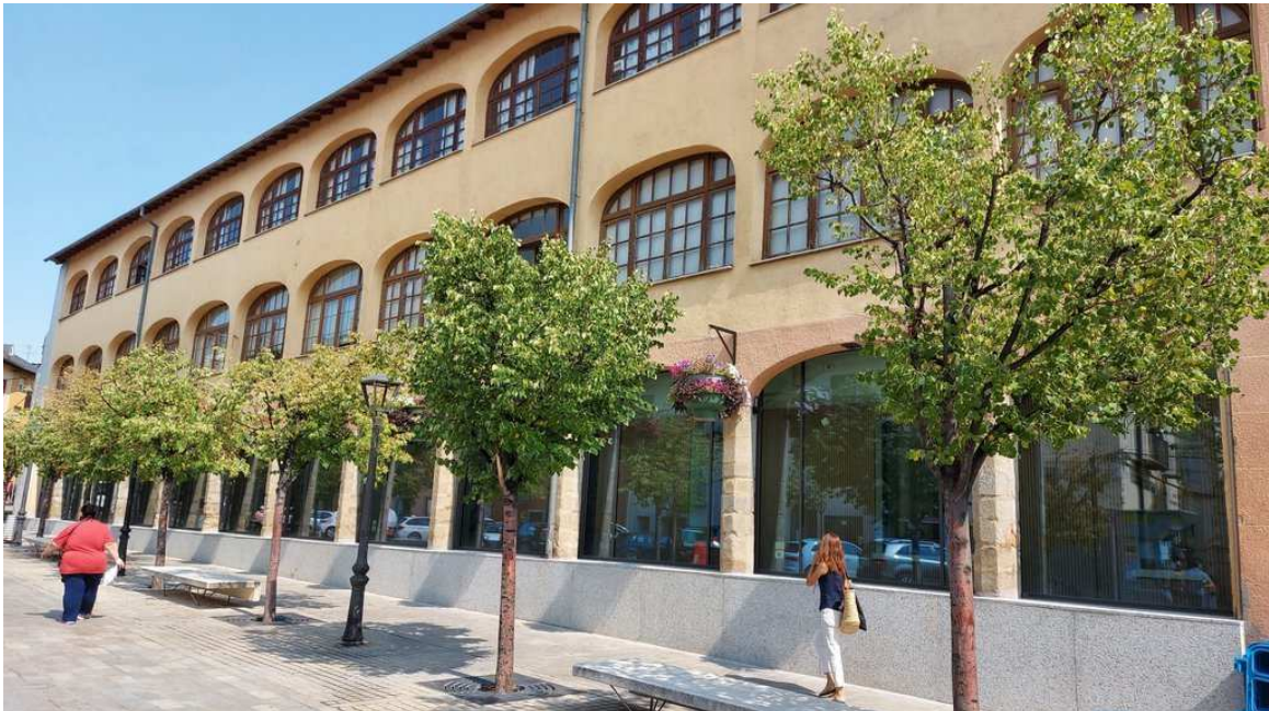
photo_camera Seu de l'Arxiu Comarcal de la Cerdanya, a Puigcerdà / Feliu Sirvent viurealspirineus

L'ERA és editada conjuntament per l'Arxiu Comarcal de la Cerdanya, el Grup de Recerca de Cerdanya i Edicions Salòria