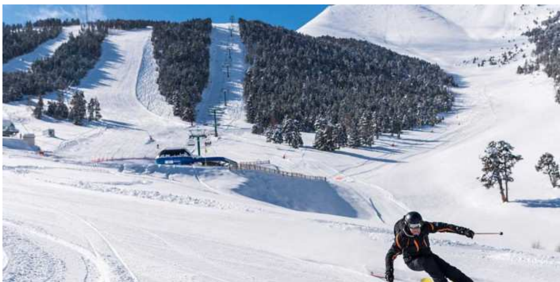
Forfets de temporada 23-24 de les estacions FGC a preu de promoció fins al 26 de novembre

Descomptes de fins al 20% i nombrosos avantatges per a compres realitzades abans del 26 de novembre