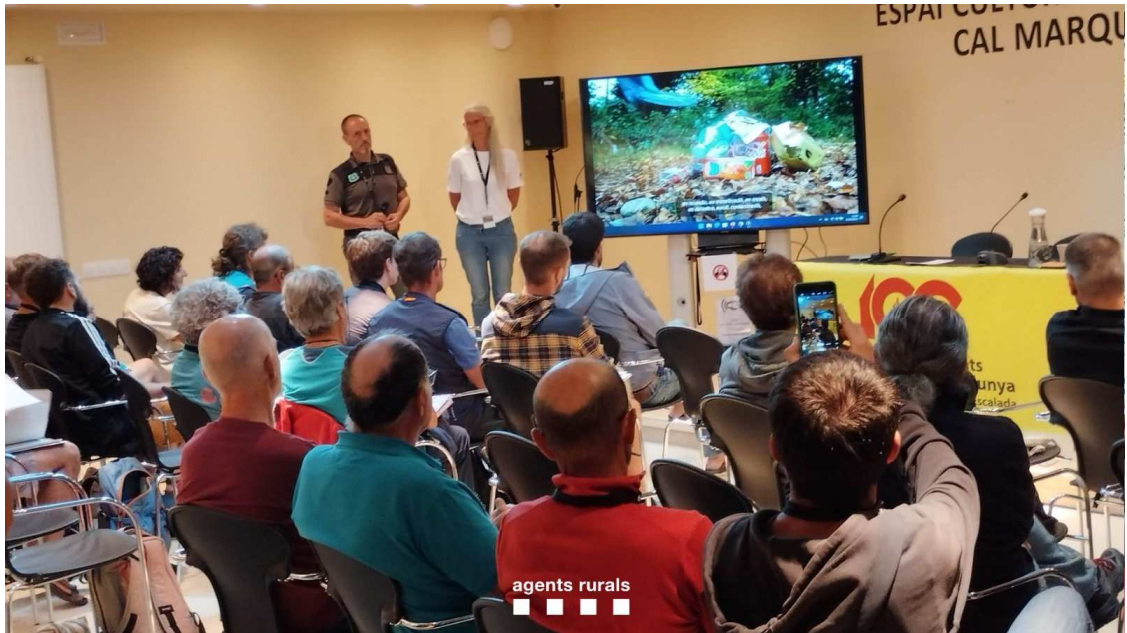
Els Agents Rurals, la FEEC i la Fundació Kilian Jornet presenten la campanya "A la natura, no hi deixis rastre"

El Cos d' Agents Rurals juntament amb la Fundació Kilian Jornet i la Federació d'Entitats Excursionistes de Catalunya (FEEC) inauguren una iniciativa educativa amb el nom " A la natura, no hi deixis rastre ". El seu objectiu és despertar la consciència social dels infants i de tota la ciutadania, perquè durant la seva visita respectin la natura i no hi deixin cap rastre.