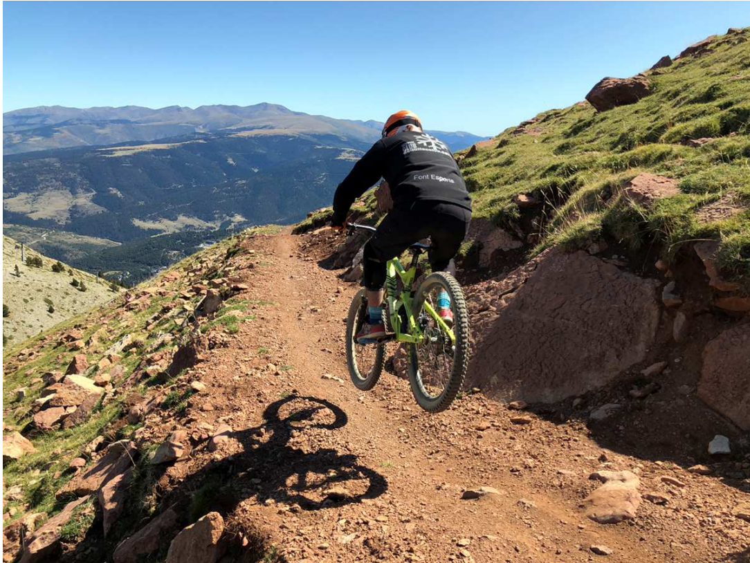
bikepark de La Molina.