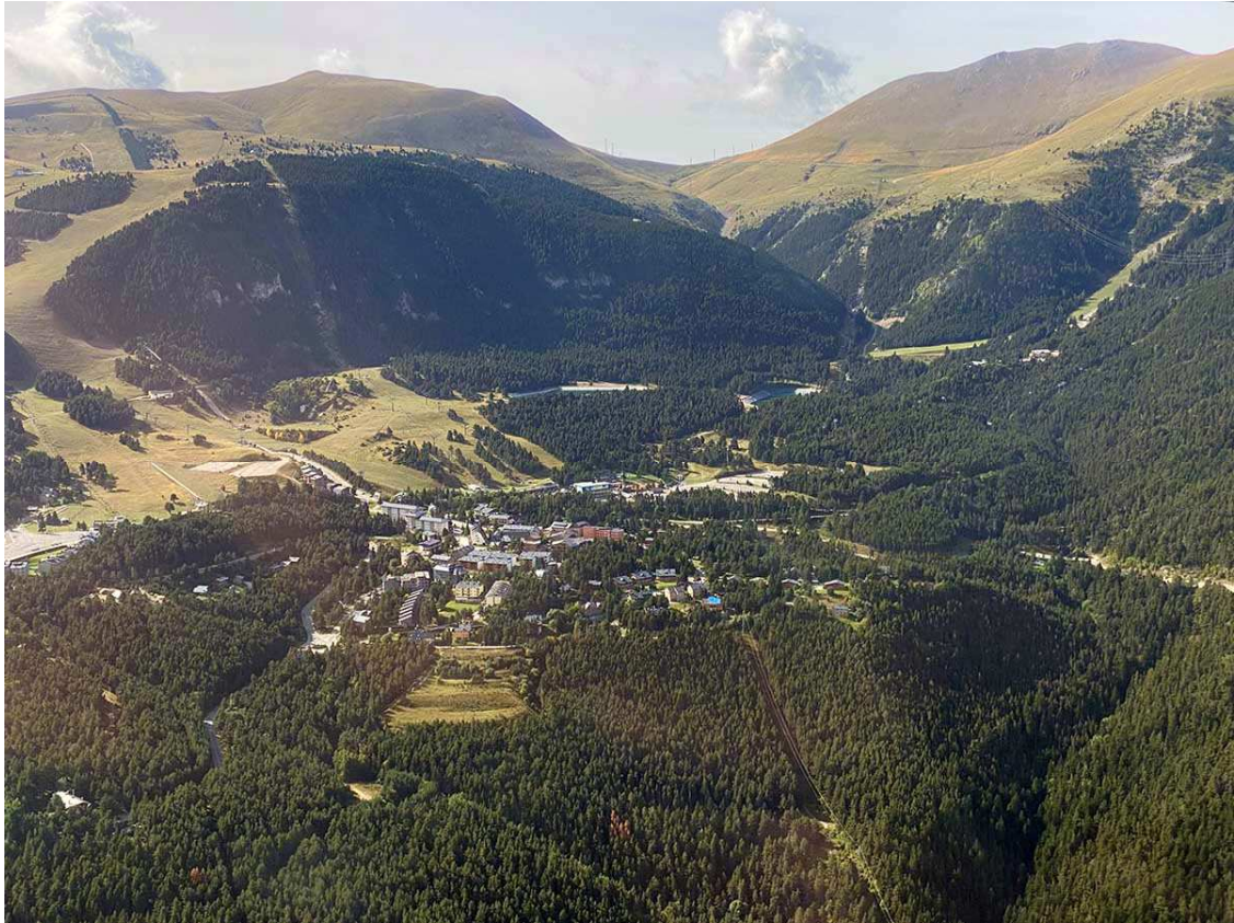
Estiu a La Molina

Destaquen en aquesta estació activitats com la pujada en telefèric, el parc lúdic, l'hípica i les barques, sense obviar el senderisme, una de les principals activitats de la vall. Així mateix, les persones que han visitat Núria han pogut gaudir de l'Exposició " Centenari Josep Danés " exposició que commemora els 100 anys de la primera pedra de la remodelació del Santuari.