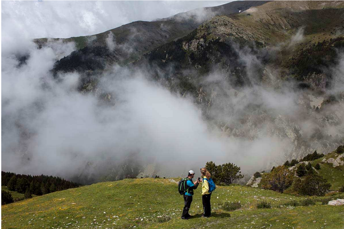
Entorns de Vall de Núria a l'estiu.

A la vall veïna, també situada al Ripollès s'ha registrat una temporada força positiva, amb un augment del 17% en el nombre de bitllets de telecadira venuts respecte de la temporada amb 6.234 forfets. Vallter, és d'entrada al parc natural de les Capçaleres del Ter i del Freser amb accés als cims que assolixen pràcticament els 3.000 m. La temporada d'estiu de Vallter va iniciar a mitjan juliol amb l'esdeveniment Experiència Vallter Natura. Aquesta activitat va ser exclusiva per a tots els membres del club Pirineu365. La jornada va constar de la pujada amb el Telecadira Panoràmic fins a 2.535 m, arribada al Mirador de la Costa Brava, tast d'embotits i formatges a la cafeteria Marmotes, ruta guiada pel nou Circuit d'Orientació tot visitant el naixement del riu Ter i les antigues ruïnes del Refugi d'Ulldeter.