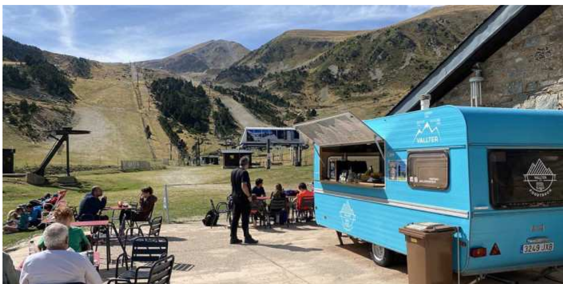
Temporada d'estiu de 'rècord' de visitants a La Molina, Vall de Núria, Vallter i Boí Taüll. Image d'aquest setembre a Vallter

Han registrat 139.915 visitants entre l'1 de maig a la Diada