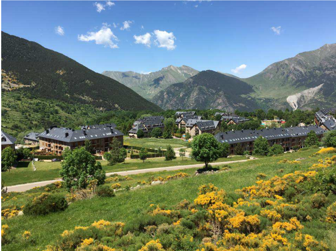
Pla de l'Ermida, peu de pistes d'estiu i d'hivern de Boí Taüll (Arxiu).

Més cap a ponent, ja a l'Alta Ribagorça, Boí Taüll va reprendre l'activitat aquest estiu com la quarta estació de muntanya de FGC Turisme amb oferta estival. L'activitat estrella ha estat la gimcana digital, una activitat divertida per aprendre, relacionar-se amb el medi, la cultura i el patrimoni de la vall, fent una activitat física saludable gaudint de la muntanya. Aquest centre turístic del Pirineu també ha ofert aquest estiu espectaculars excursions guiades amb e-bike. L'esdeveniment més destacable ha estat el Garmin Mountain Festival el primer cap de setmana de juliol.