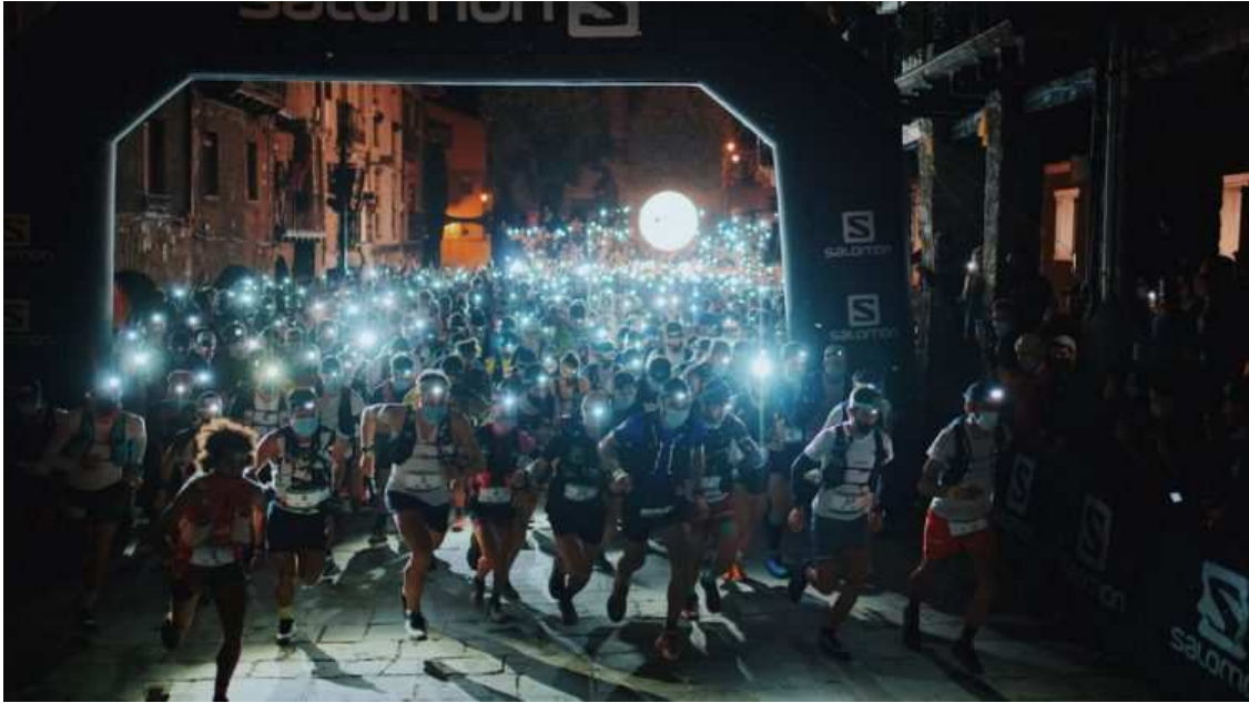
Salida de Ultra Pirineu 2021