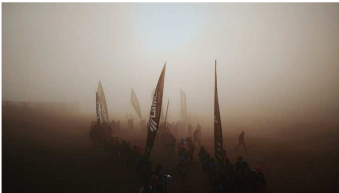
Ultra Pirineu 2021

Más tarde, en 2014, se decidió crear la Ultra Salomon Nature Trails, competición que en 2015 se consolidó como la actual Salomon Ultra Pirineu, que perdura hasta el momento.