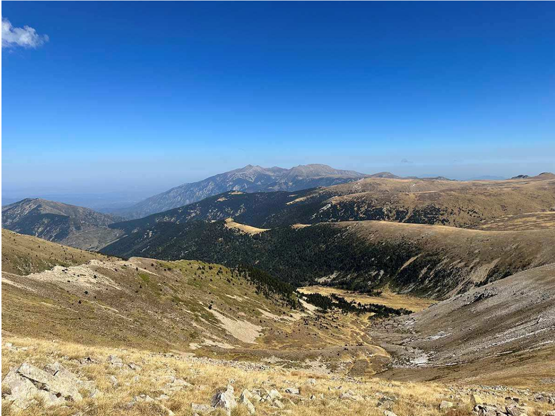
La vall de Mentet vista des de prop del cim del pic de la Dona. Al fons, el massís del Canigó.

Però, també en paral·lel, eren anys en els quals la consciència ecològica començava a despertar. I ho va fer de forma constant. I va ser aquesta consciència la que va frenar la construcció de la nova estació d'esquí. Però no només la consciència ecològica, sinó que sembla hi devia pesar força el fet que els impulsors no eren locals i que, en conseqüència, van pensar que bona part dels suposats beneficis no es quedarien a la vall.