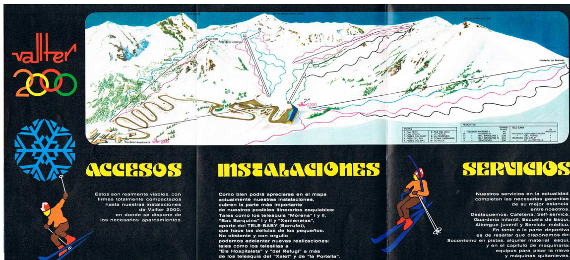
Plànol real de pistes i de projecció de Vallter a finals dels anys setanta.

Actualment, el poble de Mentet, a 1558 m d'altitud i de poc més de 31 habitants (segons dades Wikipedia de 2020), s'hi accedeix per la mateixa carretera sinuosa (D-6) que fa 50 anys, amb la qual es connecten amb Vilafranca de Conflent, que és la població més important del seu entorn. Aquesta carretera passa pel Coll de Mentet, a 1.750 m, una collada que és el punt més baix entre el Puig del Senyor (1.959 m) i el Roc de la Llobeta (2.244 m).