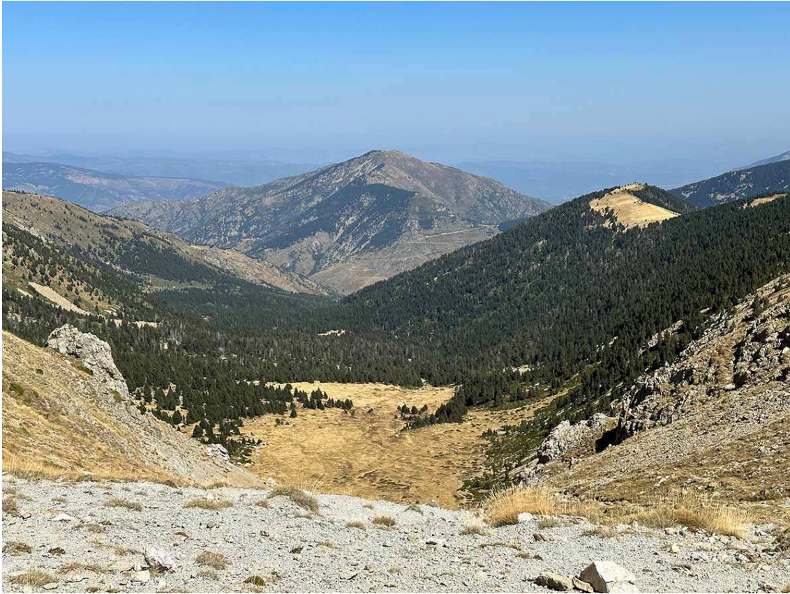
La vall de Mentet i el Puig del Senyor vistos des de la Portella de Mentet (2.412 m).

Val a dir que en aquells anys setanta a tot França van néixer molts projectes de nous centres d'esquí, tant als Alps com al Pirineu. La neu era un recurs natural que bona part de la societat civil, econòmica i també política entenien que es podia aprofitar per a generar activitat econòmica i riquesa.