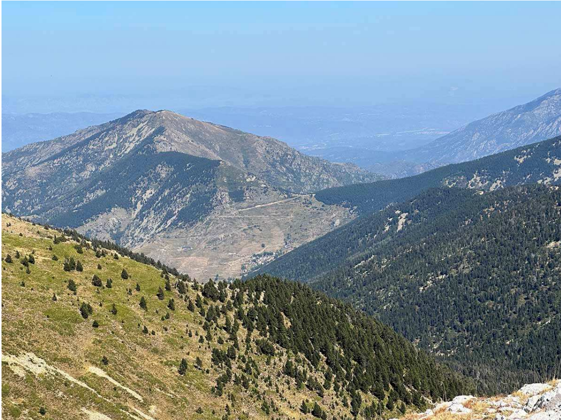
El poble de Mentet, al fons de la vall, i la carretera D-6 que la comunica amb Vilafranca del Conflent pel coll de Mentet, a una altitud de 1.750 m. A l'esquerra, el Puig del Senyor sembla controlar a distància l'entrada a la vall.

Va ser a finals dels anys 70 del segle passat quan es va fer públic el projecte d'una estació d'esquí a Mentet (Comarca del Conflent, Catalunya Nord, Departament dels Pirineus Orientals de França). Més enllà de la vall de Camprodon, pocs recorden aquest projecte que tenia previst connectar-se a l'estació d'esquí de Vallter 2000. Ho hauria fet per la Portella de Mentet, una collada de muntanya situada a 2.412 m que és el punt d'unió més baix entre les dues valls. En aquest sentit cal recordar que alguns plànols de pistes de Vallter 2000, tenien dibuixat un remuntador i dues pistes entre la Portella i el Pla de Morens.