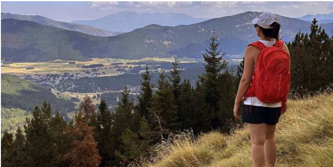
Captura d'estiu a la pista Le Bac de Formigueres. Al fons el masís del Canigó i al centre el poble de Formiguera.

Dues captures amb sis mesos de diferència i que transmeten la mort d'alguns arbres