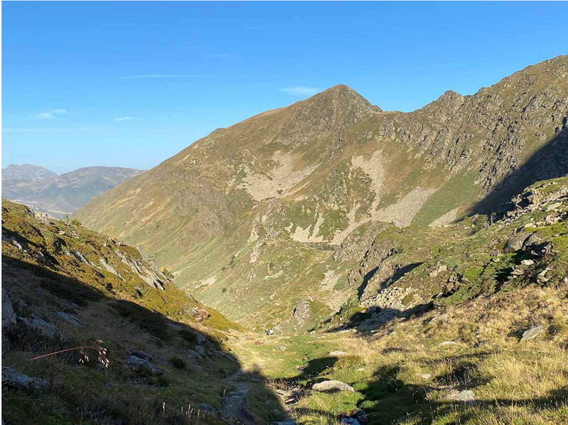
S'observen, diminuts, dos excursionistes pujant pel tram final de la Coma d'en Garcia. Al fons, a la mateixa vertical, el pic de Querforc, i entremig molt petit l'estany d'en Mercader.