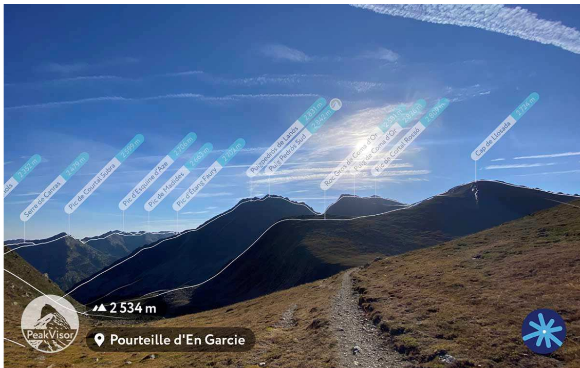
Panoràmica des de la Portella d'En Garcia en orientació sud est (Peakvisor App).

Excursió circular al Coma d'Or, cim fronterer entre l'Arieja i la Catalunya del Nord, amb sortida i arribada al coll del Pimorent. Sortida realitzada el 19 d'agost de 2023.