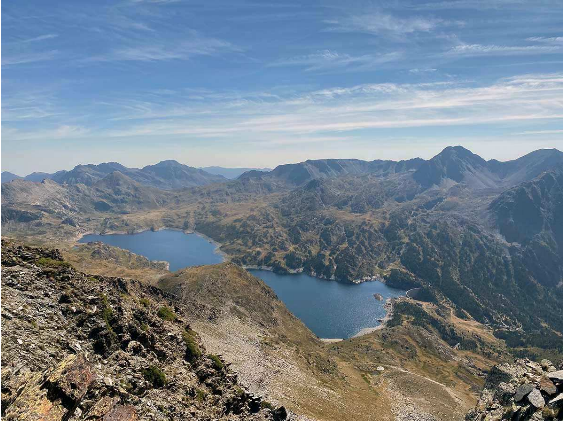
Llac de Lanós (Lanoux) des del Pic de Cortal Rossó.