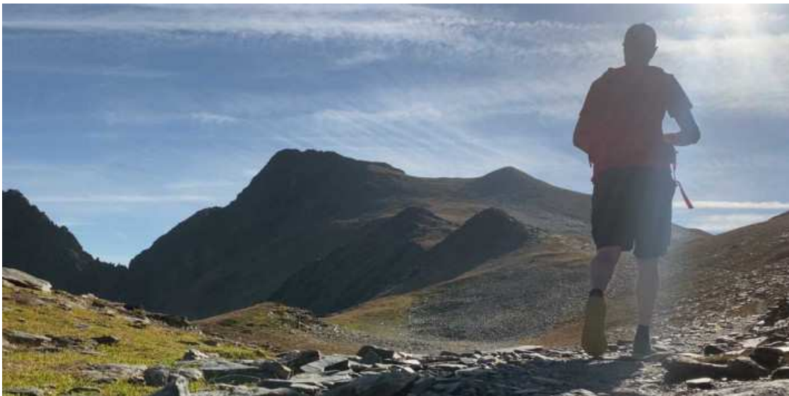
Excursió circular d'estiu al Coma d'Or (2.821 m) Autor/a: Diaridelaneu

Circular de 15,7 km i 900 metres de desnivell al puig de Coma d'Or (2.821 m) amb tornada per Cortal Rossó