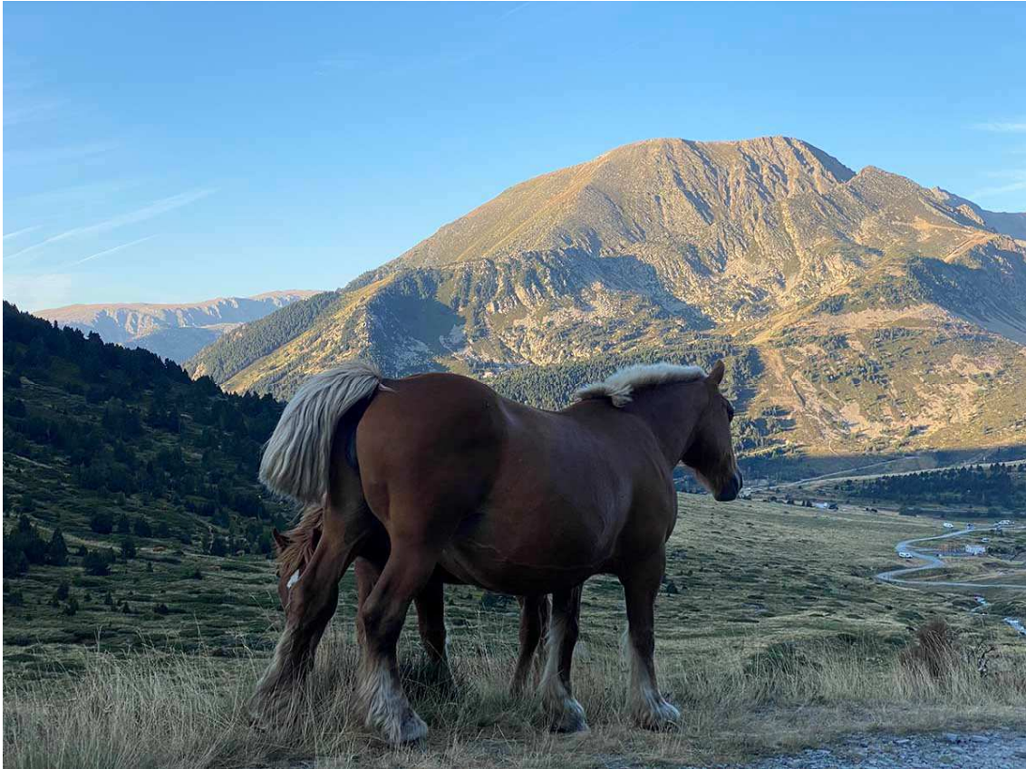
Egua i poltre al camí que remunta per la Coma d'en Garcia. Al fons, Portè-Puymorens.