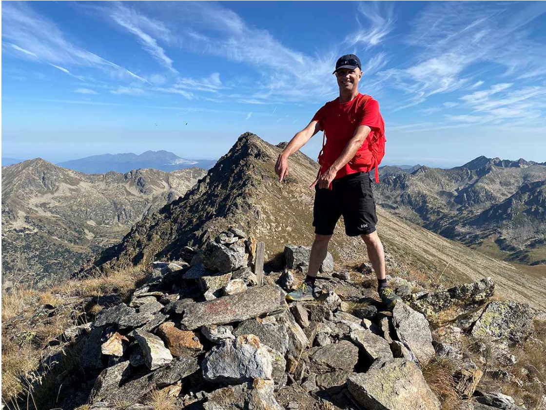
Suposat autèntic pic de Coma d'or

Per arribar al segon cal passar un pas una mica compromès per la seva caiguda aèria pel vessant nord. Fa respecte, i tot i no ser un pas tècnic, s'ha d'anar amb compte. Amb equilibri. Ara bé, us el podeu estalviar perquè, de fet, un cop sereu al segon pic fa la sensació que és lleugerament més baix que el primer. I ho admeto: de baixada, en el pas que passa per sota per evitar el tram aeri, em van tremolar les cames!