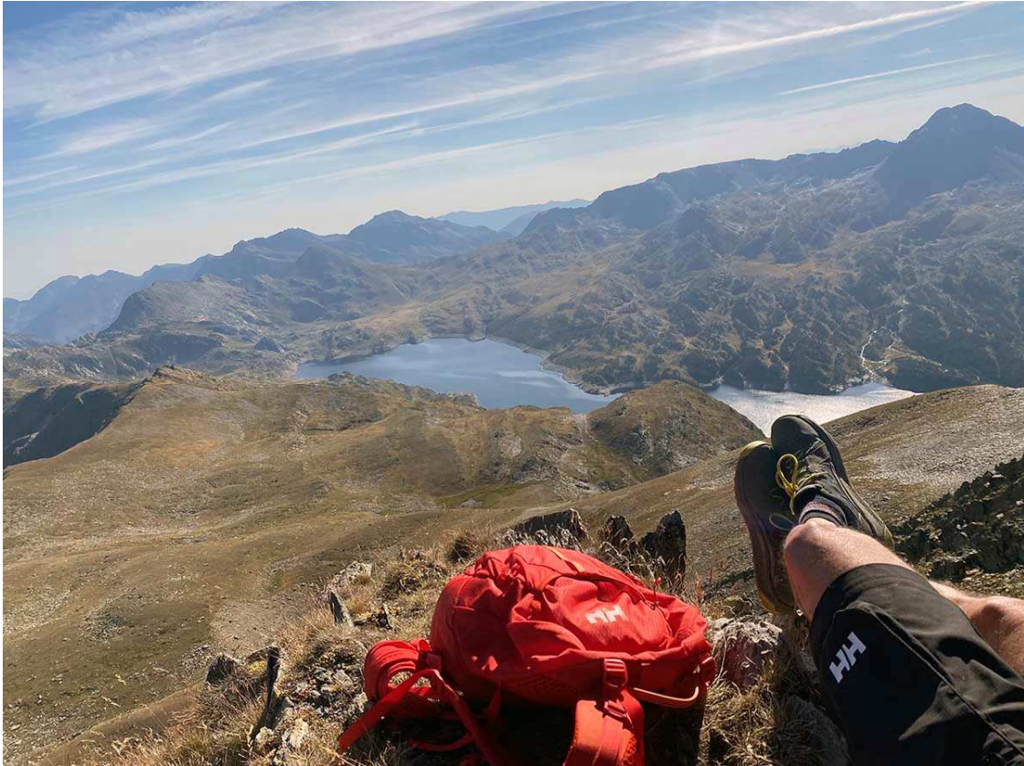
Llac de Lanós al centre i a la dreta el pic del Carlit.