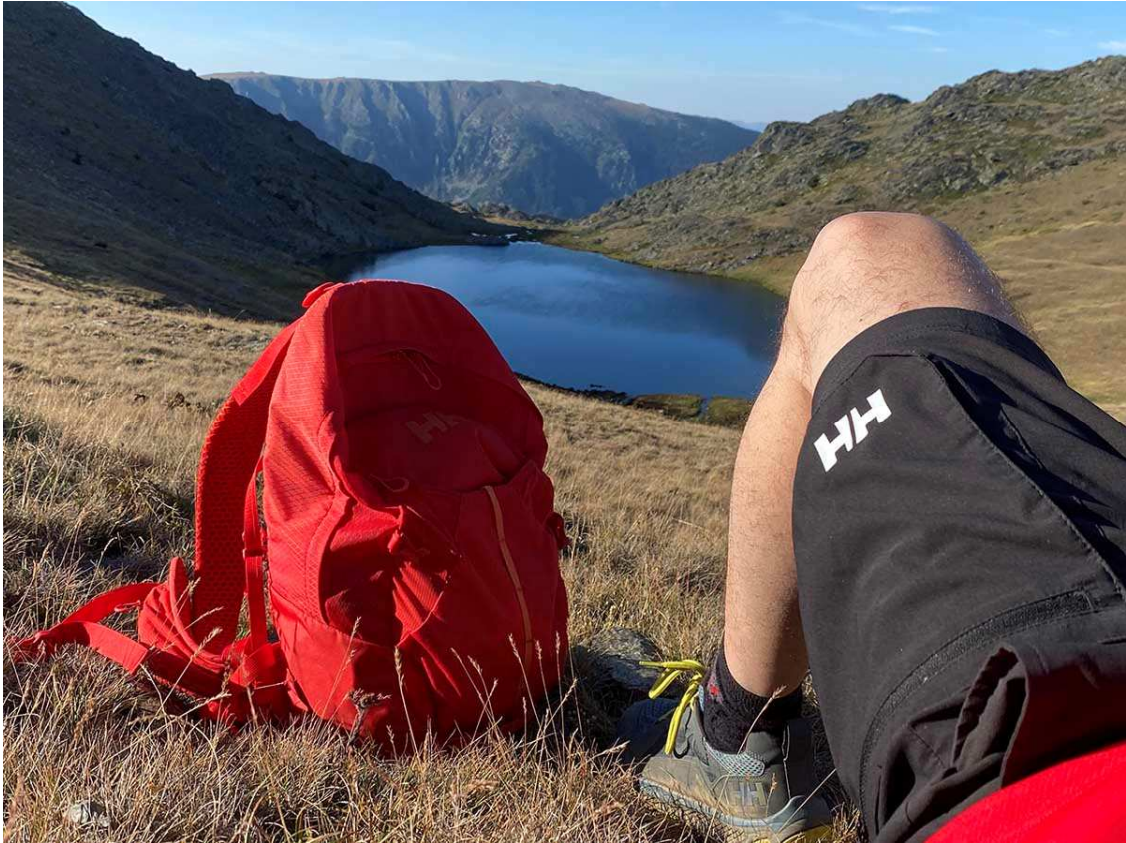
L'estany de Coma d'Or, a mig camí de pujada, un bon paratge per al descans i recuperar forces:

Alternativament, podem iniciar un descens en direcció sud-est fins a la Portella de Cortal Rossó, a 2.530 m, des d'on gaudirem d'una magnífica panoràmica sobre el llac o estany de la Coma d'Or. Per fer una parada i esmorzar crec que la puc qualificar com a millor opció.