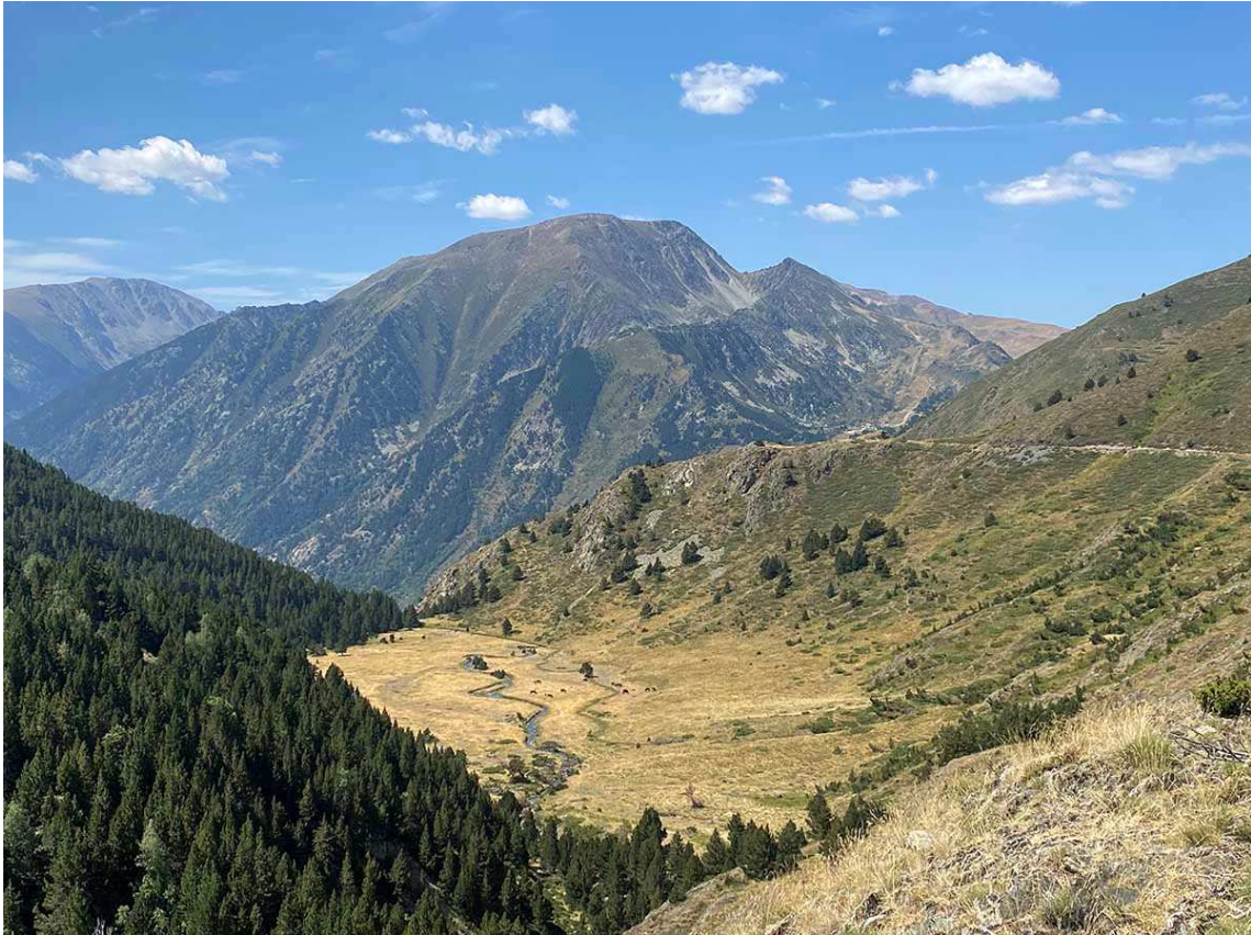
Baixada per Cortal Rossó. Al fons Porté-Puymorens i pic de Font Freda.

Quan ja haurem travessat la zona de prats humits, la plana s'estreny pel seu perímetre de sud-oest i enllaça amb un camí ample i ben fressat. Es tracta d'una pista forestal que permet el pas dels vehicles a motor que deuen fer servir els vehicles de l'empresa hidroelèctrica i dels operaris de manteniment de les pantalles anti-llau de la zona.