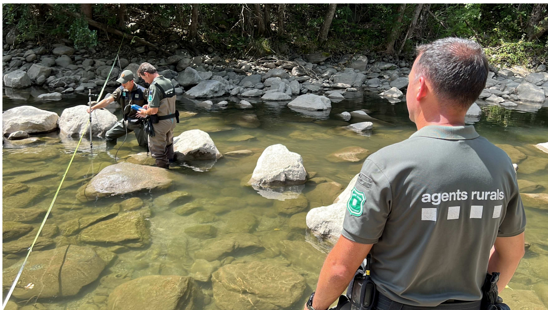
La capçalera del riu Segre té trams per sota del cabal ecològic

mesures que es planteja és organitzar rescats de peixos per traslladar-los a altres punts on es puguin garantir les seves condicions de vida.