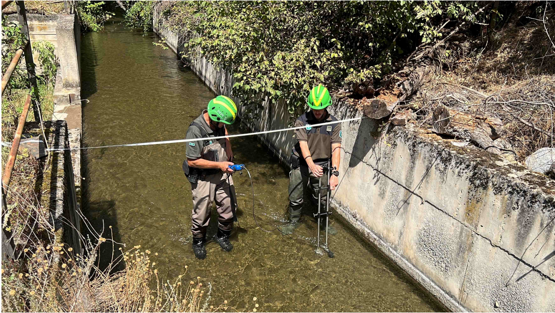
La capçalera del riu Segre té trams per sota del cabal ecològic

Les mesures s'han fet amb un aparell que compta amb un sensor d'ultrasons. Aquest es col·loca en diferents punts, segons l'amplada i la fondària de la làmina d'aigua. Aquestes dades, sumades a la de la velocitat, en determinen el cabal. El sotsinspector del cos d'Agents Rurals ha dit que no es descarta fer noves comprovacions més endavant si la situació meteorològica actual no canvia i no arriben episodis de pluja.