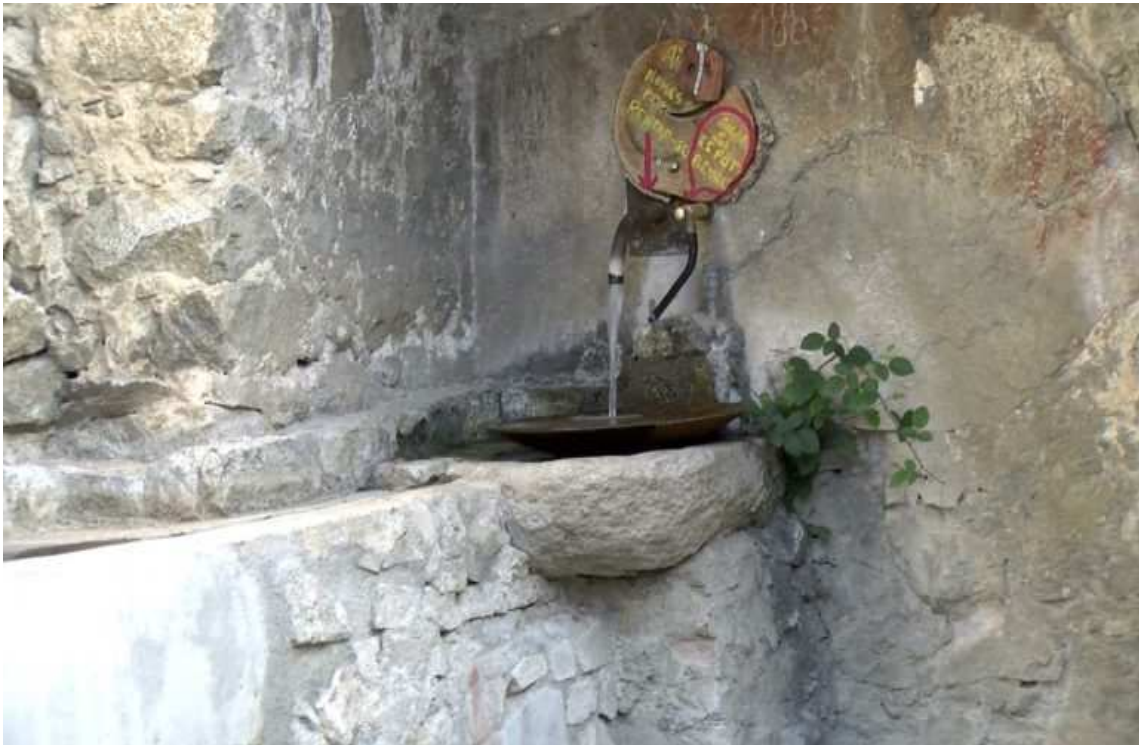
Una font de Mussa. / M.S.

L'Ajuntament de Lles ja ha iniciat una sèrie d'actuacions per prevenir futurs episodis i vol posar comptadors