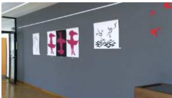
Part de l'exposició 'Ocells', a l'Arxiu Comarcal de Gerdanya.

S'han inspirat en el poemari 'Oiseaux – Ocells' que Jordi Pere Cerdà va escriure als anys cinquanta des de Naüja i l'han reinterpretat a través de diferents tècniques plàstiques. Tal com s'explica en el web de l'Arxiu, l'exposició "pretén homenatjar, a través de diferents modes d'expressió, el país i el compromís per la llengua del poeta desaparegut, els parlars simples, inventats, ancorats en una terra i una història, la de Cerdanya, que han alimentat la seva escriptura".