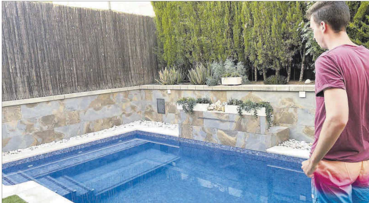
Un veí de Sant Vicenç de Castellet a la seva piscina particular