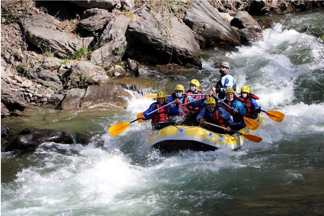
Practicant el ràfting al riu Noguera Pallaresa.