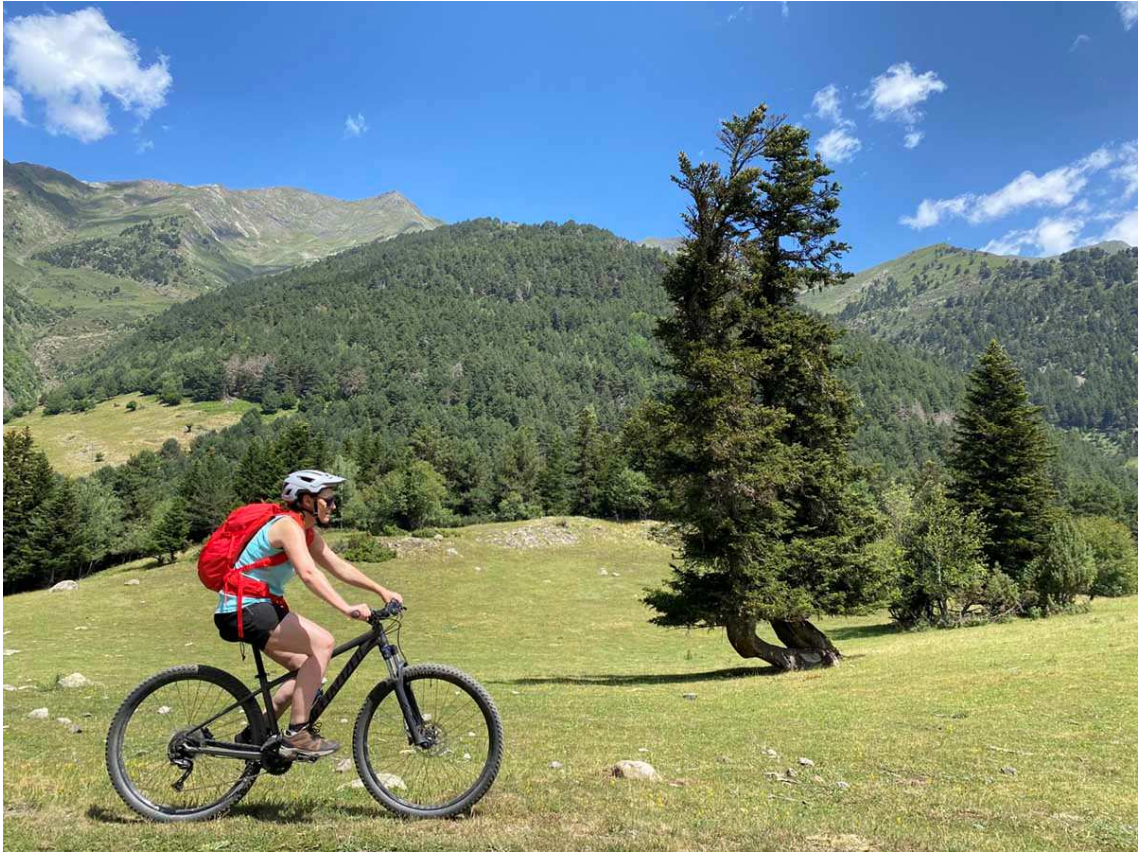
La bicicleta, una bona manera de gaudir del Pirineu.