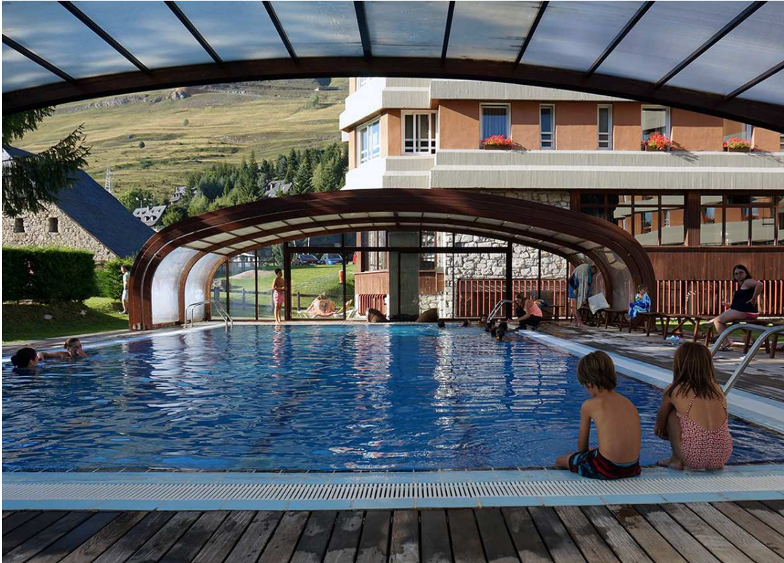
L'hotel Montarto a la Val d'Aran (Foto: arxiu BB).

Isern creu que el canvi de tendència, respecte als darrers tres anys de pandèmia i confinaments, té a veure amb les ganes de viatjar a l'estranger i la situació econòmica actual, afectada per un increment de preus. Així, en el cas de les activitats que ofereix als clients de l'Hotel Muntanya i del Càmping La Cerdanya, noten que les que tenen més interès són aquelles de caire vivencial, que són més difícils de fer sense contractar un servei.