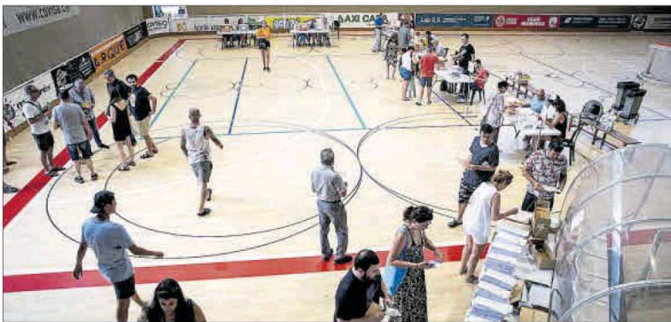
Votants al col·legi electoral ubicat diumenge al pavelló del Pujolel de Manresa

► Els socialistes han multiplicat per 10 els municipis on han estat primera força respecte a les eleccions generals del novembre del 2019