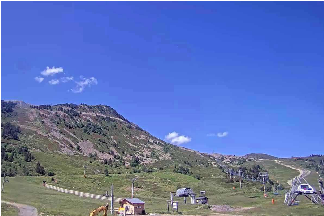
Així llueix aquests dies Porté Puymorens (Webcam 090723).