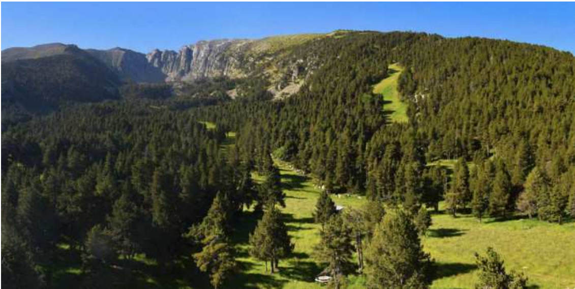
Així llueix Cambra d'Ase

Una ullada als paisatges verds que aquests dies llueixen les estacions de l'Alta Cerdanya, Alt Conflent i Capcir