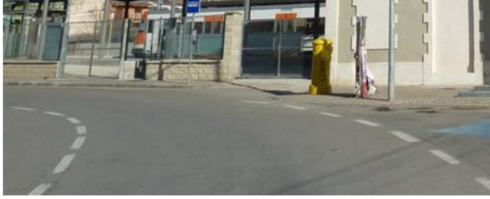
L'estació de Torelló, ara també la dels gar