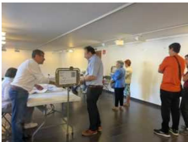
Votacions a la Seu d'Urgell.

Pel que fa a Esquerra, protagonitza una situació exactament oposada a la de Junts a l'Alta Ribagorça i al Pallars Sobirà, com si fossin vasos comunicants. On més perd Junts és on més guanya Esquerra. A l'Alta Ribagorça, la formació republicana puja de 318 a 545 vots, i de 5 a 8 regidors, gràcies al fet de poder fer noves llistes al Pont de Suert i Vilaller, a banda de la que ja tenien fa 4 anys a la Vall de Boí. Al Pallars Sobirà, els pactes amb Som Poble a Sort i el fitxatge d'alcaldes procedents de Junts ha permès als republicans ser presents a tots els municipis de la comarca, guanyant per majoria simple a la mateixa capital i conservant feus com Esterri d'Àneu, Llavorsí o Soriguera.