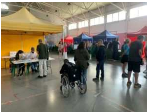
Votants a Tremp.