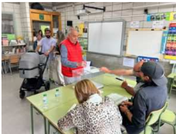
Votants a Puigcerdà.

Pel que fa a Compromís i el PSC, la formació obté els millors resultats al Pallars Jussà, on passa de 1.897 vots a 1.918 i de 16 a 20 regidors. Es beneficia de la victòria a Tremp, així com de conservar els 3 regidors a la Pobla de Segur o baixar poc -tot i que possiblement passar de 4 a 3 regidors li costarà l'alcaldia- a Salàs.