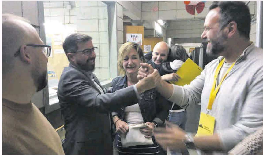
Alegria entre els components de l'equip d'ERC en saber que han guanyat el cinquè regidor i s'imposen als altres