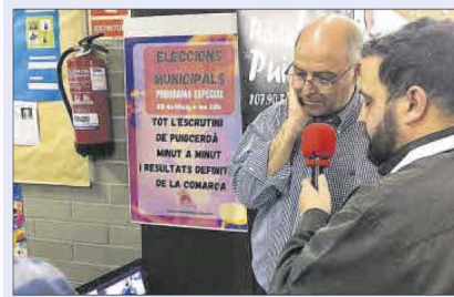
Armengol comenta els resultats a Ràdio Puigcerdà

de perfilar un govern de coalició. Si no és així, ERC també podria governar en minoria, però amb l'espasa de Dàmocles constant al damunt.